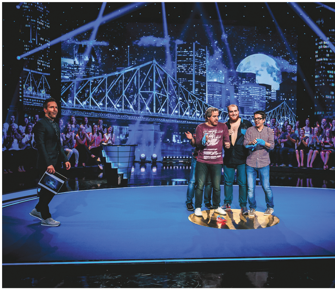
Le soir tout est permis, une émission animée par Éric Salvail, requiert les services de Public Cible.

« Il y a deux volets dans ce métier, dit la pionnière. Le volet de la gestion des demandes va tout seul quand l'émission est très populaire comme Tout le monde en parle . Le volet du recrutement est moins évident. Surtout quand une émission marche