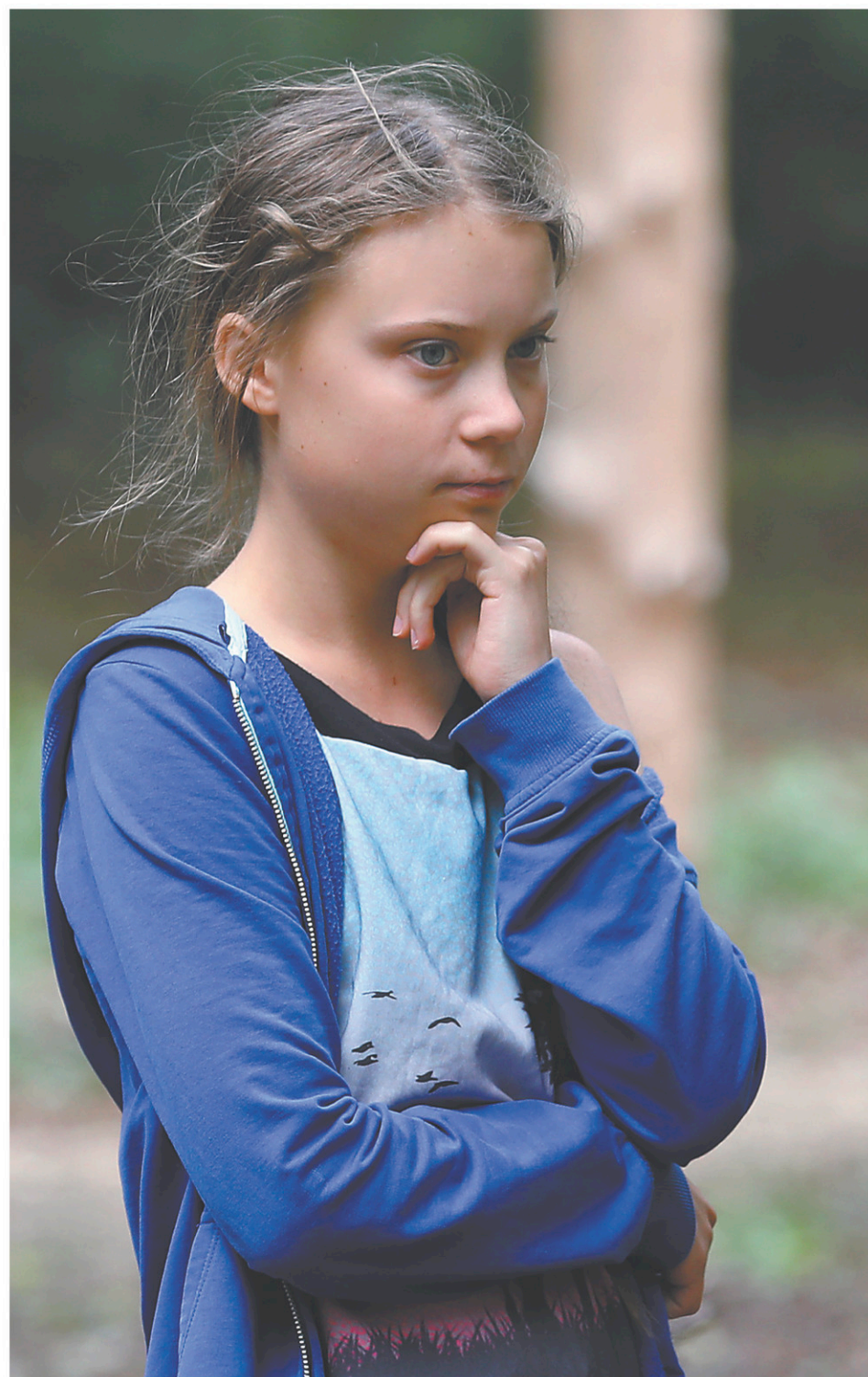
Greta Thunberg est à l'origine du mouvement de grève des jeunes pour le climat. Elle est attendue d'un jour à l'autre à New York après sa traversée de l'Atlantique en voilier. La jeune militante souhaite se rendre à Montréal et manifester avec les jeunes Québécois le 27 septembre.

La militante souhaite participer ici à la grande manifestation du 27 septembre