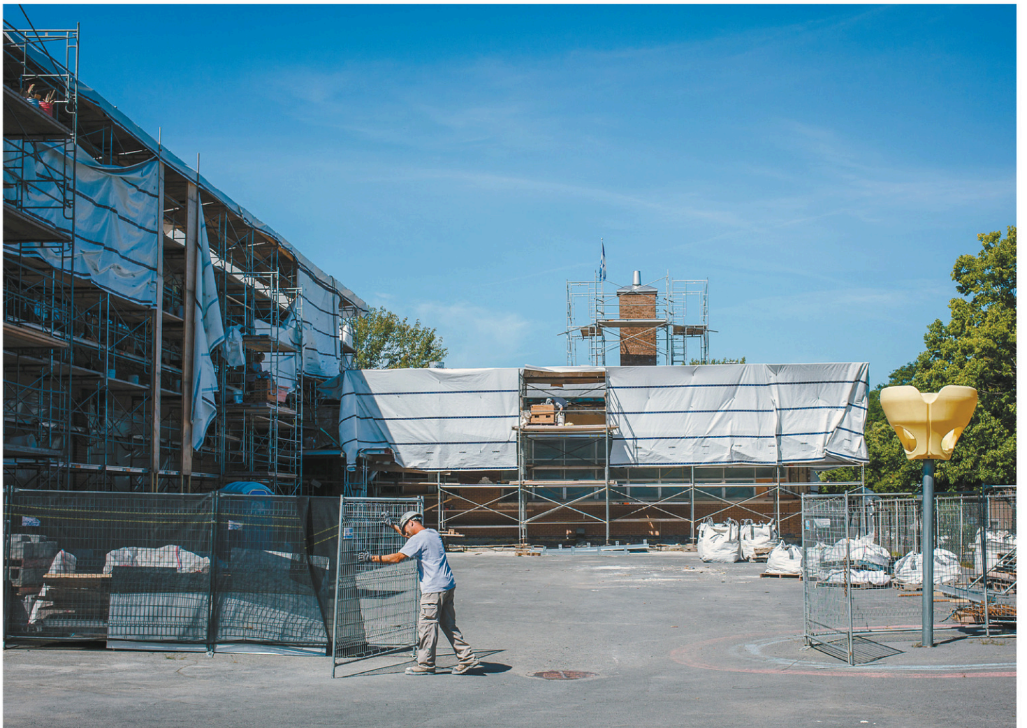
À l'école Saint-Jean-Vianney, comme dans bien d'autres établissements scolaires, les ouvriers sont toujours à l'œuvre alors que la rentrée des écoliers s'amorce.