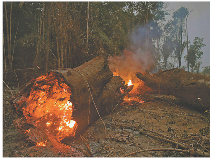
Les causes de la destruction en cours de l'Amazonie attestent de mises à feu délibérées pour élargir les zones de culture.

Plus près de chez nous, des dizaines de professionnels de l'information s'affairent avec bon nombre de chercheurs à décortiquer les effets des pesticides sur notre environnement et notre santé.