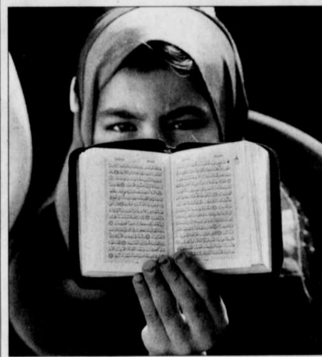
Il semble bien que le Coran soit à la mode depuis le 11 septembre 2001.

La prière la plus importante de la semaine se déroule le vendredi à 12 h 45. Il est préférable de la réaliser en groupe, à la mosquée. Deux locaux sont aménagés pour cette prière collective : une mosquée située dans l'avenue Myrand et une salle du pavillon Lemieux de l'Université Laval. Tous les vendredis, 350 à 400 fidèles s'entassent dans ces endroits étroits, pour accomplir leurs rites. L'acquisition d'un terrain en vue de construire une deuxième mosquée est un projet porté, depuis des années, par le CCIQ qui a même lancé un appel de souscription. Selon les responsables du Centre, la présence musulmane à Québec justifie l'édification d'un nouveau lieu de prière.