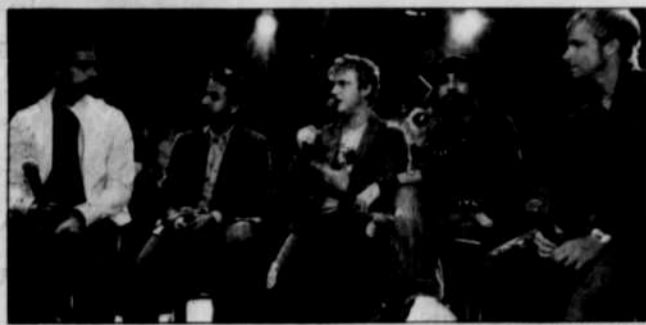
Les Backstreet Boys se confèrent à Sonia Benezra.

FRÉDÉRIC BOUDREAU Collaboration spéciale