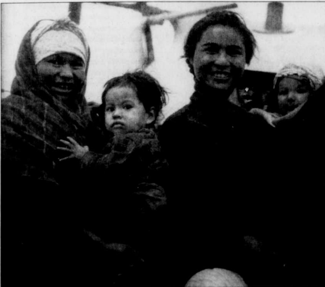
Ils se sont prêtés au jeu, ces gens que l'on disait sauvages!