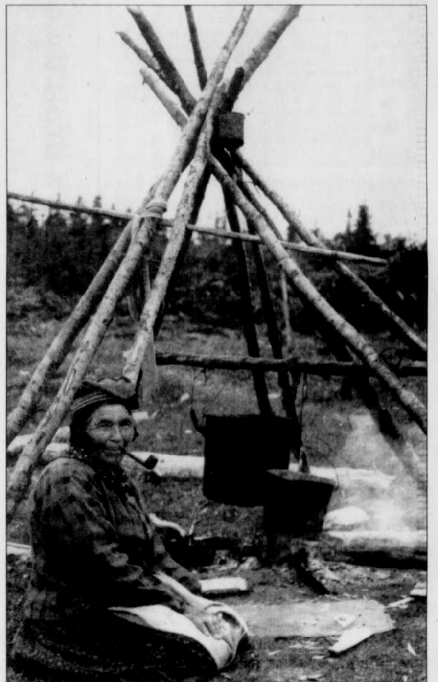
Les Amérindiens acceptaient de bonne grâce de se faire croquer en train de fabriquer un canot, un tipi ou une cabane ronde.