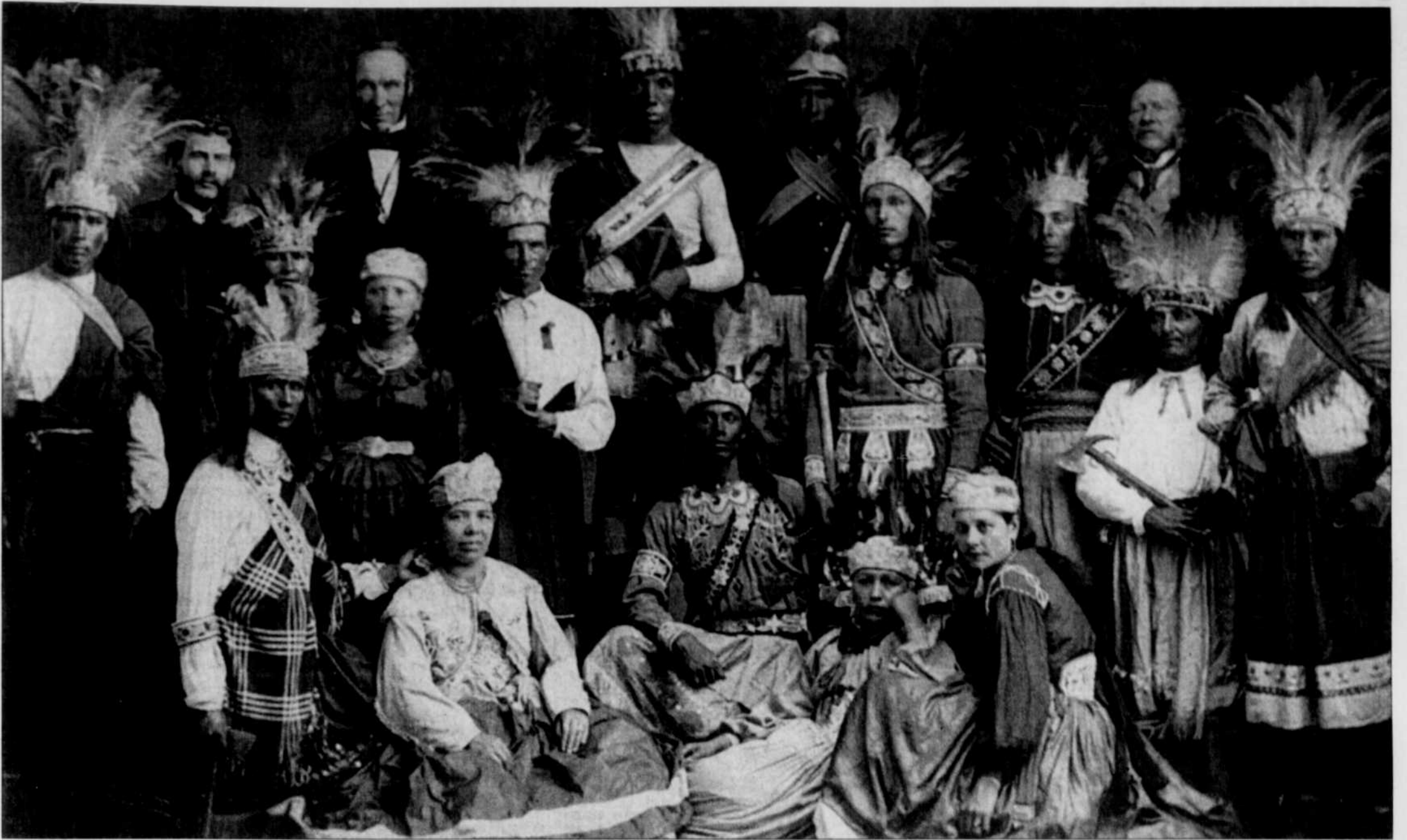
Les clichés réunis dans l'ouvrage « Sur les traces des Amérindiens » mentent innocemment, n'étant que des mises en scène.