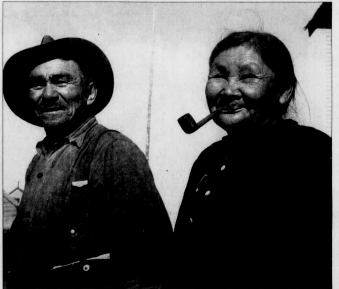
Ces images sont les seuls témoignages visuels que nous ayons d'une époque révolue.