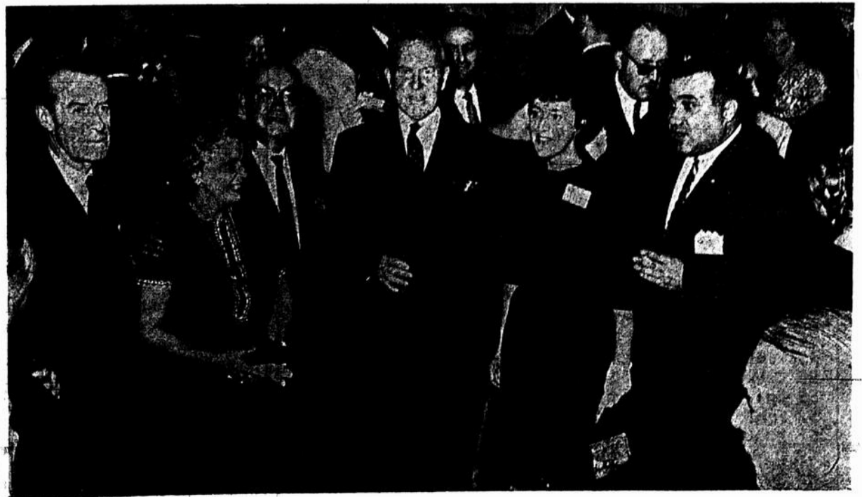
Le Très Honorable Lester B. Pearson, Premier Ministre de notre pays, était l'invité d'honneur au congrès annuel de l'Association des Hebdomadaires de Langue Française du Canada, qui s'est tenu au Manoir Richelieu de Murray

Membres Lacordaire et Ste Jeanne-D'Arc, nous savons que vous ferez votre devoir et que vous assisterez des plus nombreux afin d'apprécier la grande hospitalité de NOTRE-DAME du Cap, et surtout de la remercier des nombreux bienfaits qu'ELLE nous accorde.