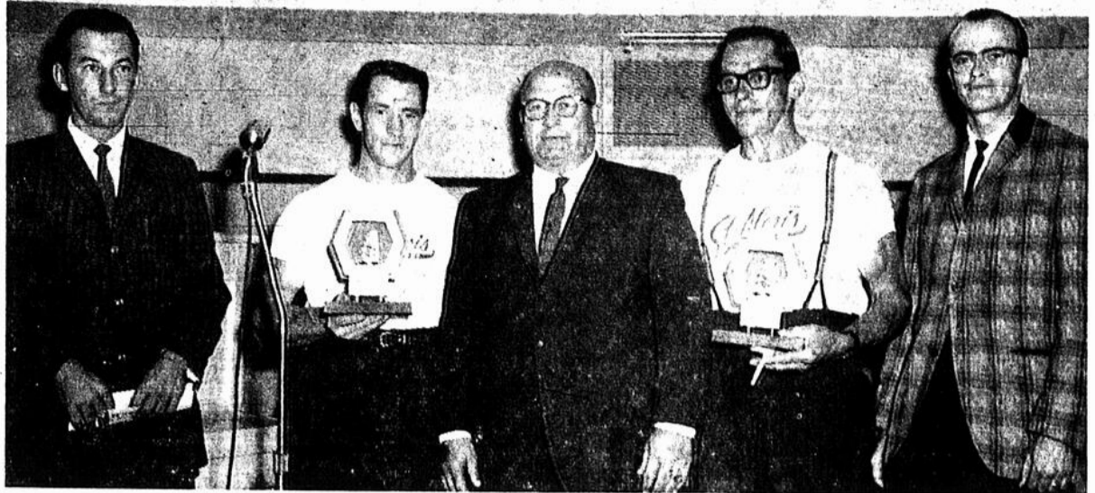
La Classique de Canots entre St-Paulin et St-Alexis a connu, cette année, un éclatant succès. Il y eut vingt-huit départs et tous ont croisé la ligne d'arrivée. Dans toute épreuve il y a un gagnant. La marche a été si exténuante que les avirons que l'on croyait de quelques centimètres trop large, avaient la largeur réglementaire à l'arrivée. Depuis quelques années cette classique de canots est organisée par le Jeune Commerce de St-Alexis-des-Monts. Une foule innombrable a assisté au départ et à l'arrivée des avironneurs. Permettez-moi de vous présenter