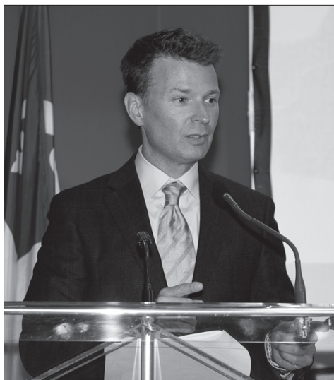
L'animateur de la Soirée des Mérites et des prix Francopub, Stéphan Bureau