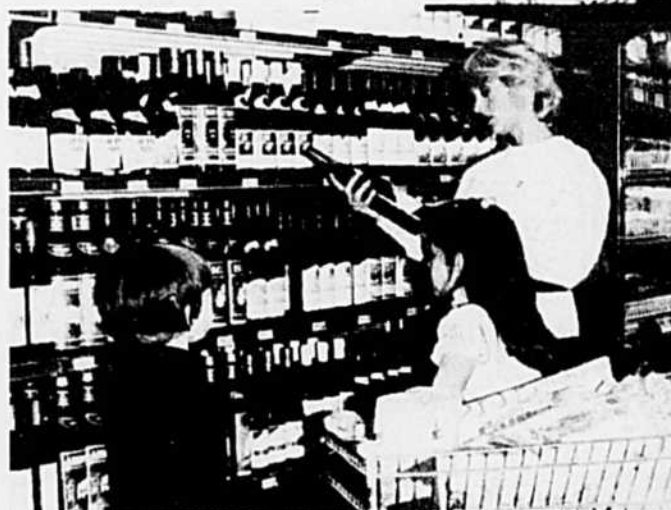
Sans oublier les vins.