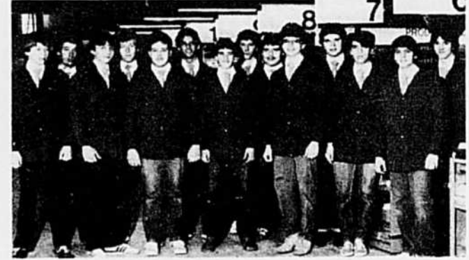
Les préposés à l'emballage.