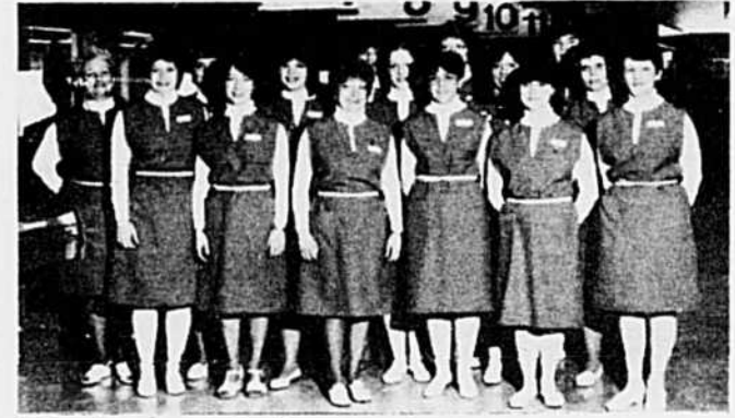
L'équipe des caissières.