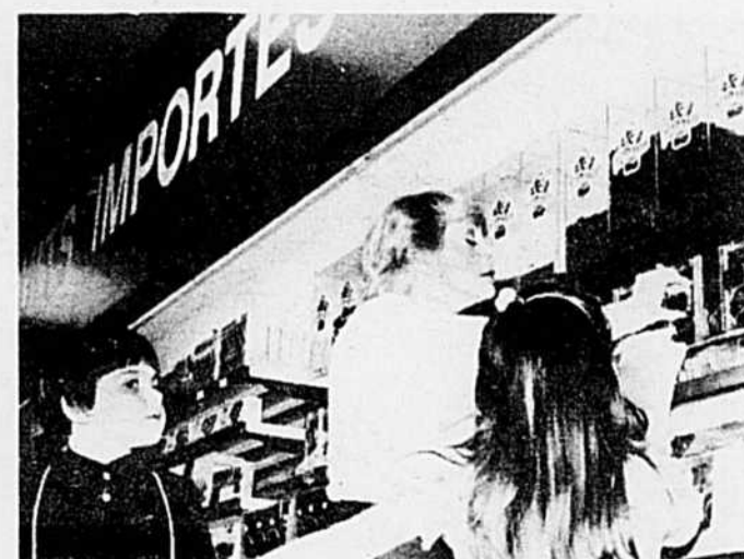
Des produits importés et du café en grains.