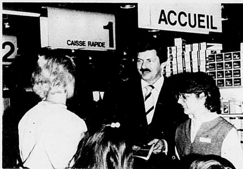
Un accueil chaleureux dès l'entrée et d'un département à l'autre.