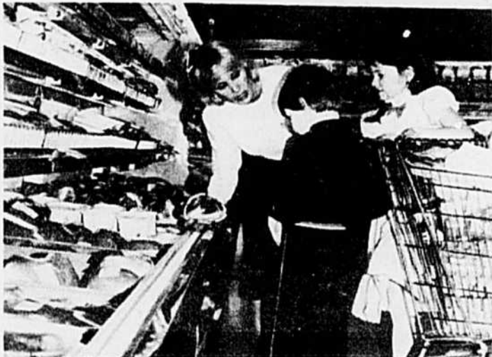
Des viandes de qualité boeuf Mérite.