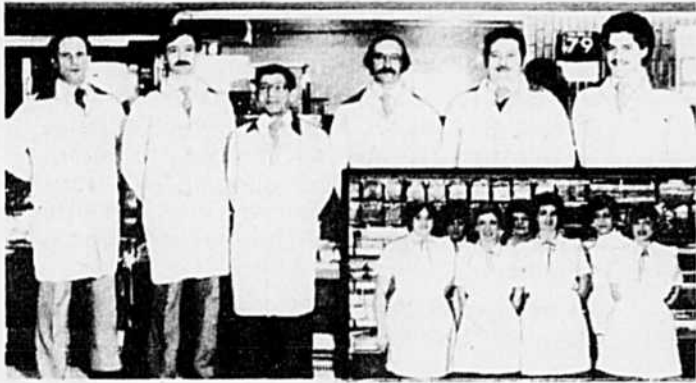
L'équipe du département des viandes.