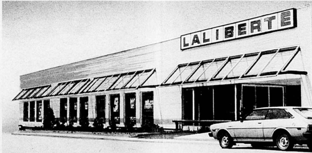
... au supermarché d'aujourd'hui.

Marché Laliberté inc. réponse à ses besoins : du nécessaire comme la viande ou le lait, au plus raffiné comme les produits importés ou les fruits les plus exotiques, sans oublier le pain frais cuit sur place, maintenant disponible.