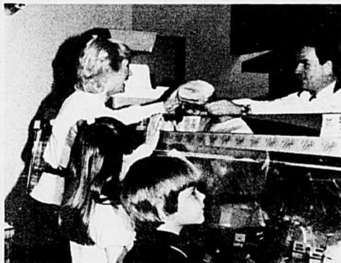
Une charcuterie de choix et des coupes spéciales.