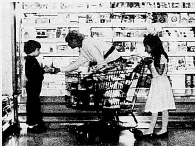
Des produits laitiers courants et des fromages fins.

LE PLAISIR DE MAGASINER DANS DES ALLÉES SPACIEUSES ET UNE AMBIANCE AGRÉABLE.