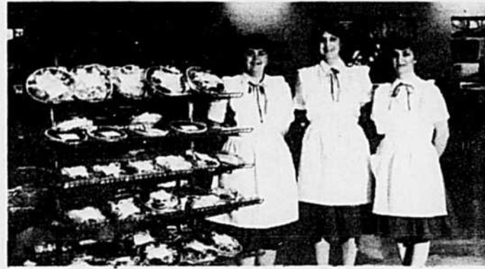
L'équipe du nouveau service de boulangerie.