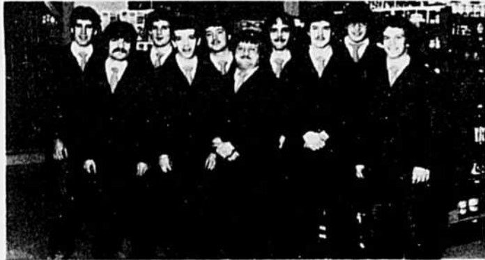
L'équipe des responsables de l'étalage (nuit).