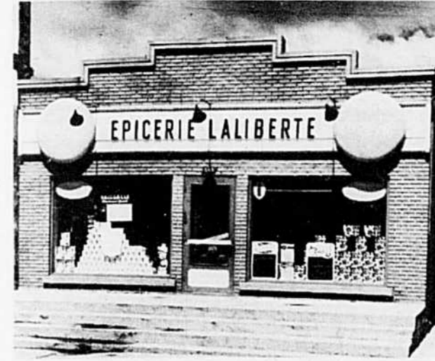
Du premier édifice en 1954...

Pourtant chacune (ce sont les femmes qui en majorité font le marché) est assurée de trouver au