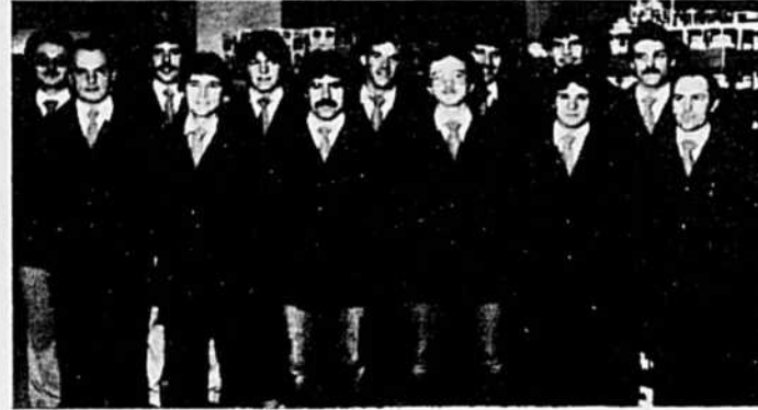
L'équipe des responsables de l'étalage (jour).