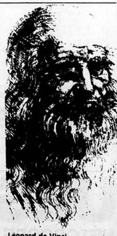
Léonard de Vinci

14:30 (2) (3) (4) — «L'enfant sauvage» De Truffaut, un film basé sur un fait divers authentique: un enfant sauvage retrouvé dans les bois au 19e siècle. Il choisira la civilisation. 20:00 (2) (3) (4) — Des dames de coeur Mais quand va-t-on savoir qui est au juste la fille de Claire? Quelle angoisse! 20:00 (8) (9) (10) — Happy Birthday Hollywood Un gros show plein de vedettes pour célébrer les 100 ans d'Hollywood. Durée trois heures. 20:00 (7) — Léonard de Vinci: l'itinéraire de la connaissance Léonard de Vinci fut un des plus grands génies de l'univers. Cette dramatique évoquera sa vie et son oeuvre.