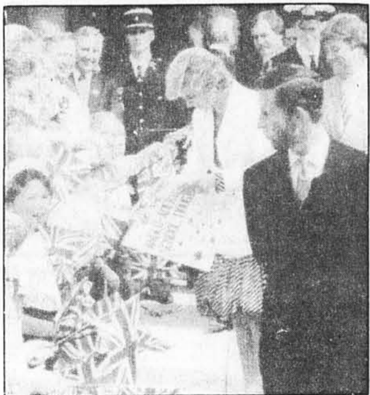
Le couple royal à Cannes

sable du clipping (revue de presse). Dès 6h du matin son équipe de 7 personnes décortique et classe tous les comptes rendus quotidiens: 70 journaux européens et américains forment un dossier quotidien de plus de 200 pages. Qui dit mieux? LE GUINNESS DU CINÉMA ■ Jean-Claude Romet a lancé vendredi à Cannes la 1re édition française du livre Guinness du cinéma. Un inventaire