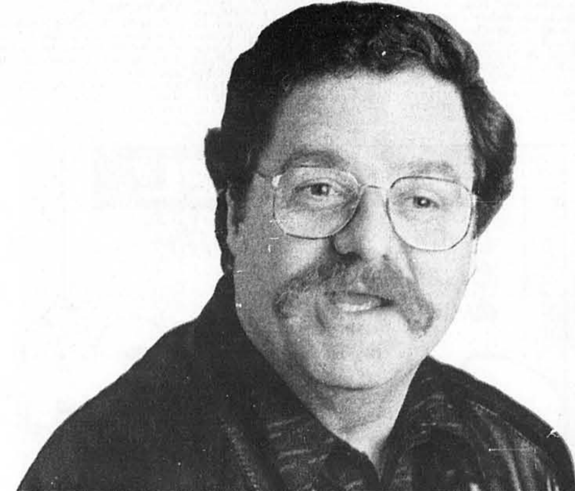
«J'ai acheté un théâtre parce que j'avais peur de ne pas jouer»

«Je pourrais faire plein de choses, nourrir toutes les ambitions au monde mais je préfère travailler avec mes forces. Je ne suis pas