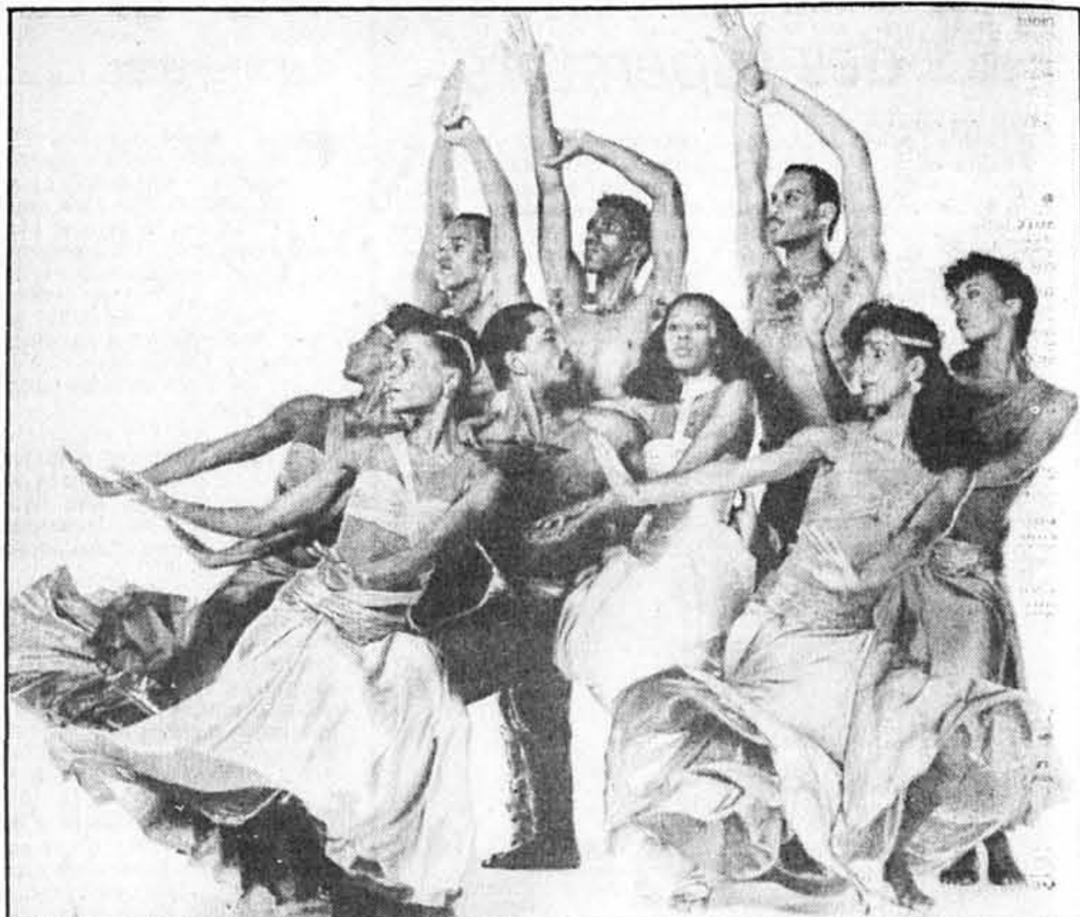
La compagnie Alvin Ailey dans «Caverna Magica»