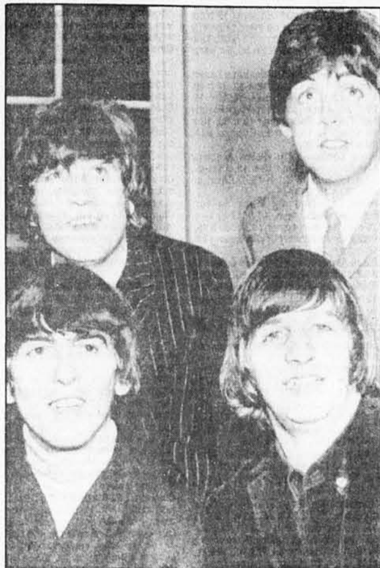
Le légendaire Fab Four : John Lennon, Paul McCartney, George Harrison et Ringo Starr

vidéoclubs des films A Hard Day's Night et Help . Le premier a été tourné en noir et blanc en 1964, en pleine beatlemania , et possédait surtout le mérite de présenter aux jeunes les quatre vedettes britanniques dans des contextes loufoques et un peu échevelés... pour ainsi dire. Le scénario est passablement simpliste, ce qui a peu d'importance dans les circonstances, mais le rythme est intéressant et les prestations musicales des Beatles toujours passionnantes à revoir. Le film Help fut produit un an plus tard, en couleur cette fois. Tout aussi échevelé que l'autre, Help est tout de même un peu plus consistant du côté du scénario: l'action est centrée sur Ringo, qui, devenant le vouloir le centre d'une bien étrange chasse à l'homme, don-