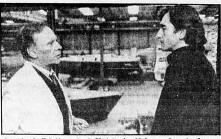
Jean-Louis Trintignant et Christophe Malavoy dans La femme de ma vie