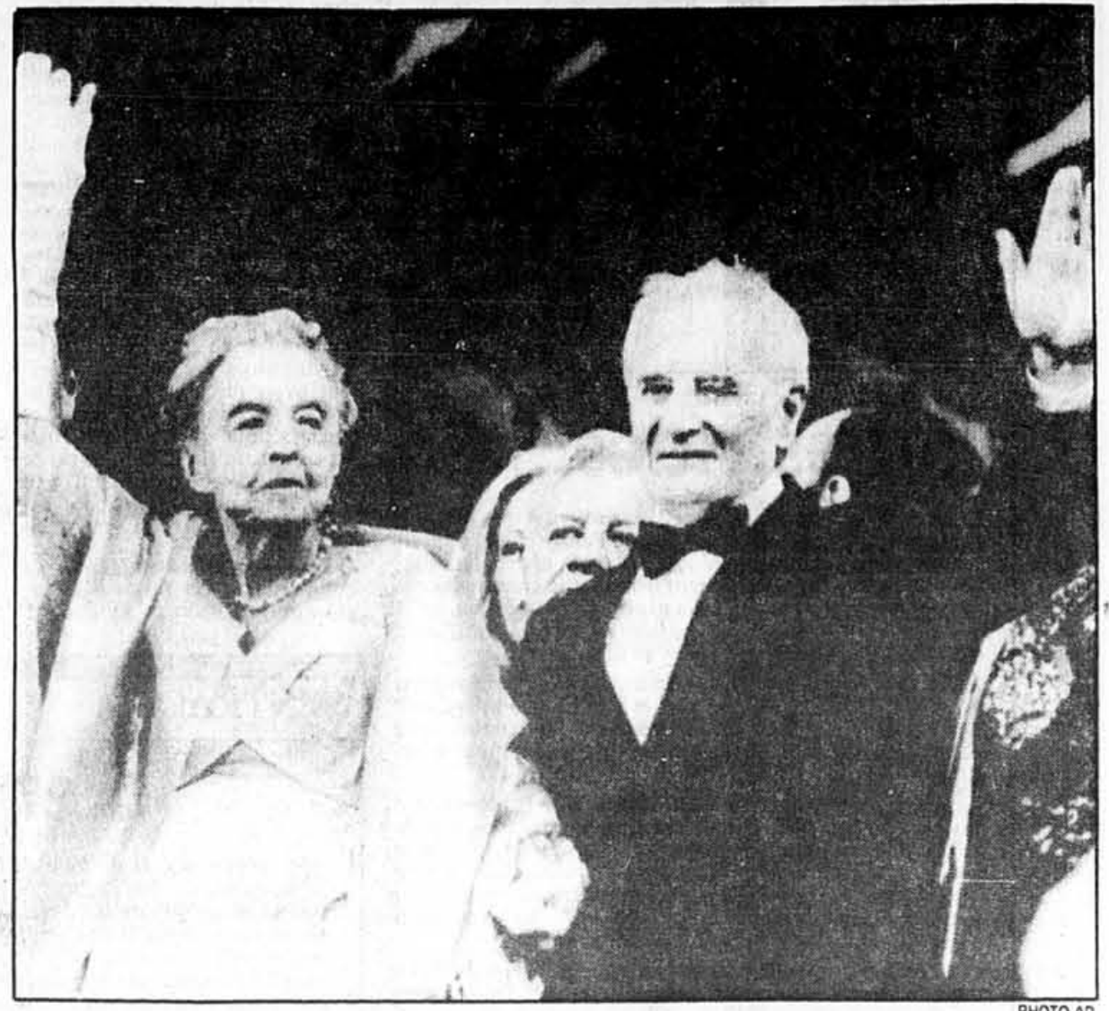
Lilian Gish en compagnie du réalisateur Lindsay Anderson venus présenter leur film à Cannes

Quant à Radio Days , il était présenté hier hors-compétition. Pendant ce temps, les yeux se tournaient vers l'espoir du renouveau du cinéma soviétique, Repentir , de Tengouz Abouladze.