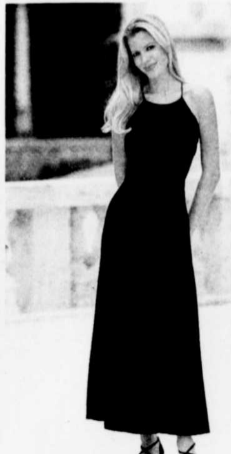
Le bleu de la robe de la fille d'honneur reprend la couleur du mariage.

La mère de la mariée, en tant qu'hôtesse, se tient à la tête de la ligne de réception. La mère du marié fait aussi partie de la ligne de réception. Sans être identiques, les couleurs des robes des mères doivent être assorties à celles du cortège. Elles doivent éviter le blanc, qui est réservé à la mariée, et le noir, qui est la couleur du deuil.