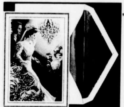
Un faire-part éblouissant pour un mariage romantique.