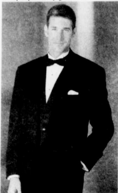
Habillé comme le marié, le garçon d'honneur lui facilite la journée.

le premier toast à la réception. Il se charge également de l'enveloppe contenant l'argent pour les frais de l'église. Puis, il s'occupe du transport des mariés et de leurs bagages au moment du départ pour le voyage de noces.