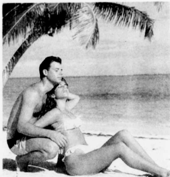
Une île romantique pour les amoureux du soleil et de la plage.

cascade d'eau magnifique, bar dans l'eau, sous-marin pour visiter les coraux, avion pour survoler les îles. Les croisières connaissent également une certaine popularité puisqu'elles offrent l'occasion de faire escale dans de nombreuses îles paradisiaques tout en offrant la vie de château sur l'eau.