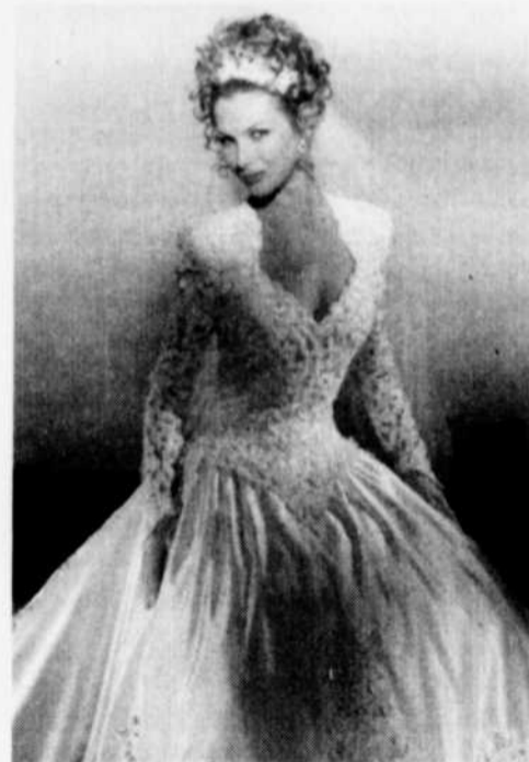
Superbe arrangement de bouclettes qui retombent avec romantisme.

N'oubliez pas que les gens veulent vous reconnaître lors de votre mariage et, d'ailleurs, vous devez certainement vouloir être à l'aise, ce qui est plutôt difficile avec une tête qui ne nous appartient pas. L'idéal est de trouver un juste équilibre entre le naturel et la coiffure des grands jours pour être belle... et un peu plus.