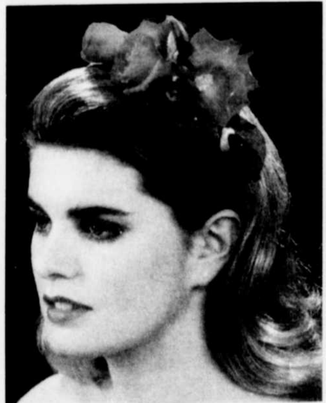
La fille d'honneur porte dans les cheveux les fleurs naturelles du bouquet.

Les souliers qui accompagnent la toilette des mères et des filles d'honneur doivent être de la même couleur que la robe. Les bijoux simples sont préférables à toute excentricité de mauvais goût. On s'assurera qu'aucun élément ne détonne par rapport à l'ensemble du cortège.