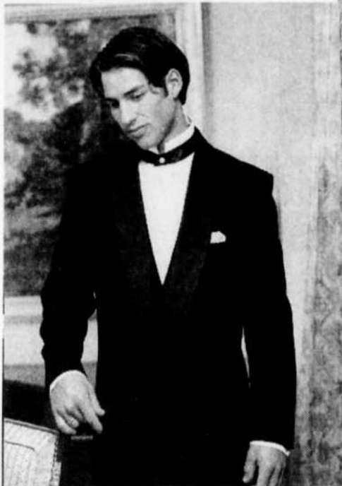
plan mise de côté