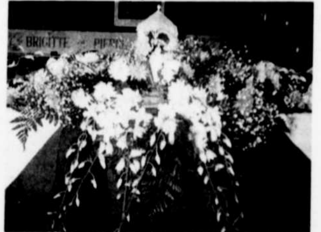
Superbe centre de table en fleurs naturelles pour décorer l'autel.

boucles pour les bancs. Ils drapent la table d'honneur et vous fabriquez un décor de rêve. Choisissez votre concept, établissez votre budget et demandez-leur de vous préparer un forfait.