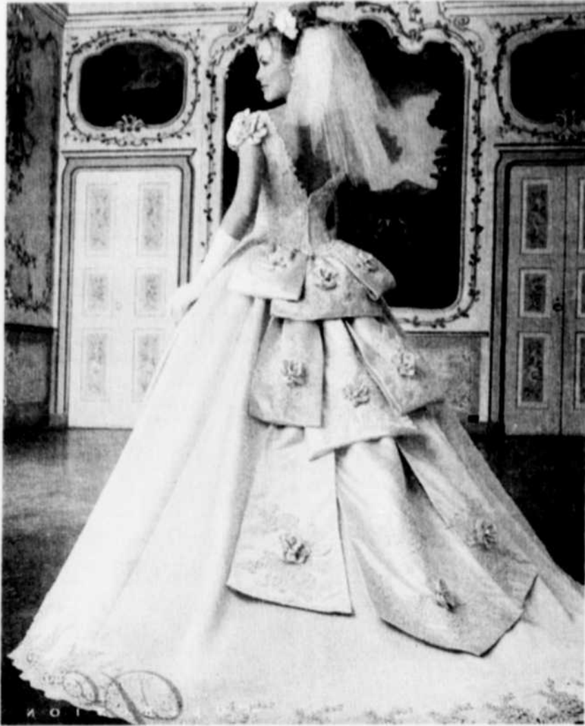
Sous un thème floral, fabuleuse robe de teinte rosée et décorée de roses.

Les manches joueront également un rôle dans le modelage de la silhouette. On pourra, entre autres, ajouter du volume aux épaules tombantes. L'apparence des bras, ni trop potelés, ni trop maigres, déterminera la présence ou l'absence de manches.