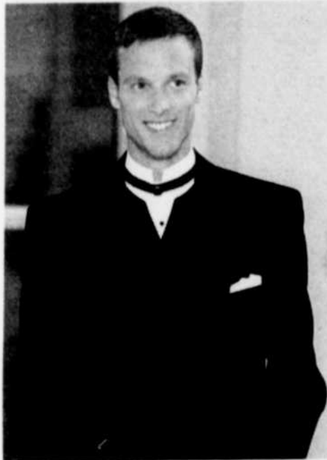
Le marié personnalise son tuxedo à col châle double en le portant avec une chemise à col montant avec bandeau noir et bouton doré, et un gilet à encolure ronde avec ouverture en V.

Finalement, les nombreux modèles de chemises, cependant toujours assez classiques, permettront de varier encore un peu plus le choix de la tenue du marié. Le marié ne négligera pas la sélection de souliers et de bas de qualité qui apportent la touche finale.