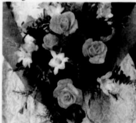
Le bouquet de fleurs naturelles apporte couleur et arôme au mariage.

robe d'apparat sont souvent accompagnés d'un bouquet de fleurs blanches. Pour les autres mariages, on choisira un bouquet composé de fleurs blanches et de couleurs en harmonie avec le thème du mariage.