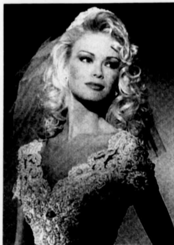
Telle une toile d'un grand maître, les touches de couleurs rehaussent subtilement la beauté de la mariée.

On devra également porter une attention spéciale aux lèvres afin de les rendre attrayantes. On en tracera le contour à l'aide d'un crayon neutre ou beige rosé. Il faudra baser le choix de la couleur du rouge à lèvres en fonction de la couleur des cheveux et du maquillage.