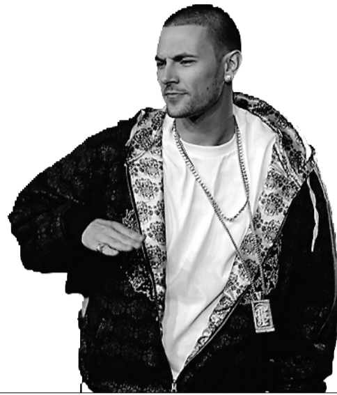
Kevin Federline