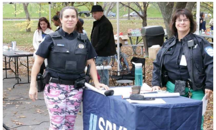
Deux agentes communautaires du SPVM