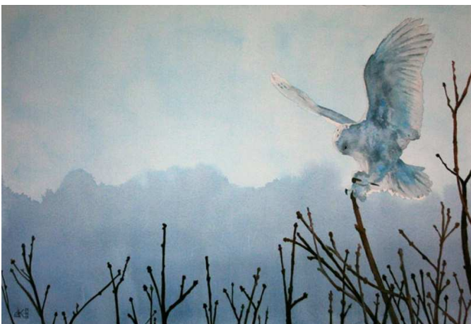
Aquarelle de Jean Kazemirchuk

Lorsque l'on se souvient des siens Émerge la lumière des liens ; Ces fils ténus et si fragiles Composés de mille gestes du quotidien De comme on dit « ces petits riens » Et c'est une fois le voyage bien entamé