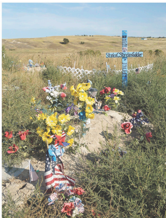
Des tombes ornées d'un cimetière lakota près de l'école. Des vagues de suicides affectent particulièrement les jeunes de la communauté.

demi de cours, du niveau débutant jusqu'à avancé. Lorsqu'ils sont en mathématiques ou en sciences, on leur exige de parler en lakota lorsqu'ils veulent sortir aller aux toilettes ou à leur casier. «S'ils ont fait des efforts et qu'ils ont pratiqué à la maison, les élèves sont pratiquement bilingues lorsqu'ils terminent le secondaire», affirme la directrice, qui observe même les élèves clavarder en lakota sur les réseaux sociaux.