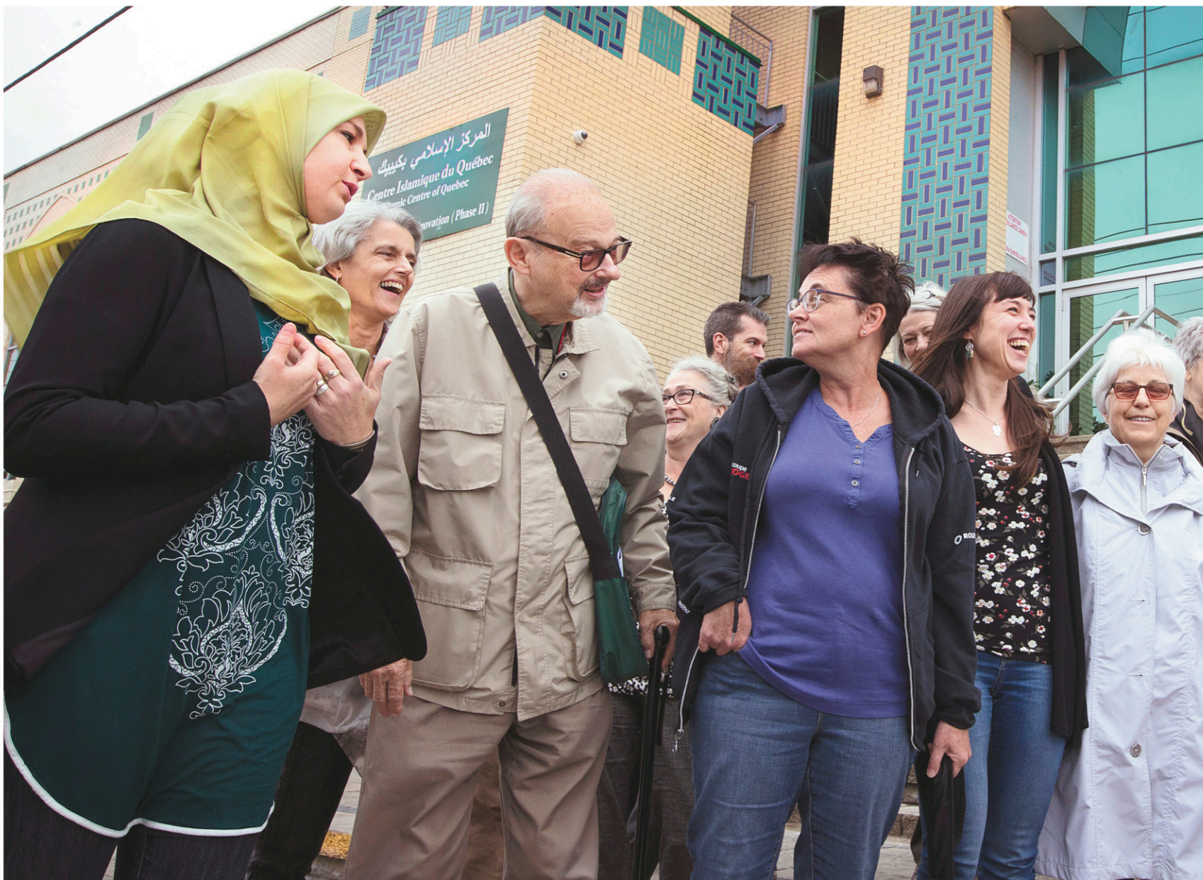
Les participants de l'activité ont fait un arrêt à la mosquée Al Islam, dans l'arrondissement Saint-Laurent, la toute première mosquée au Québec, construite en 1965.