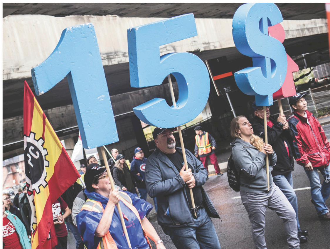
La manifestation s'est déplacée de la station de métro Lionel-Groulx au parc Jarry, dimanche.

« Nous marchons pour une deuxième année de suite pour faire entendre au gouvernement que le salaire minimum doit atteindre 15 $ l'heure le plus rapidement possible. Il doit mettre les épouvantails et les discours alarmistes de côté et s'engager à améliorer de façon beaucoup plus significative le pouvoir d'achat de milliers de personnes au Québec qui gagnent un revenu de travail