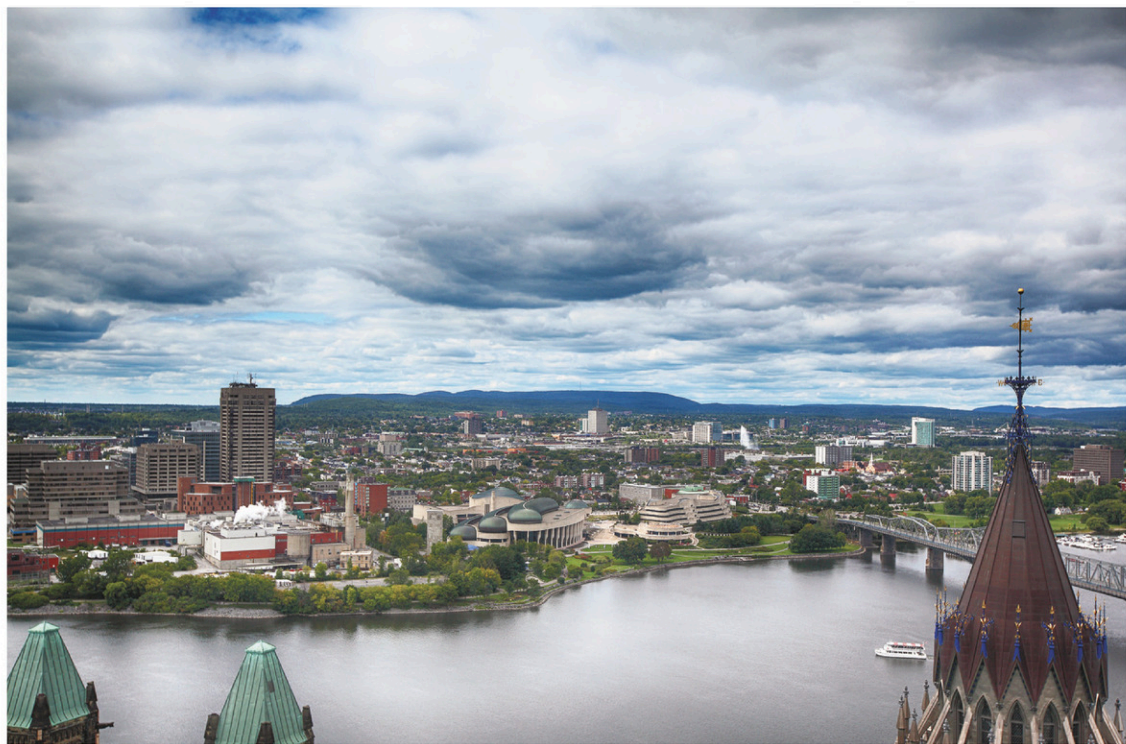
Vue sur le quartier des musées, où s'installeraient les deux tours qui créent la discorde.

Les entrepreneurs en construction et la Chambre de commerce de Gatineau, alléchés par les 400 millions de dollars que Brigil entend investir, approuvent le projet. Les citoyens du quartier touché, eux, plaident pour une densification du territoire à échelle plus humaine. Le projet est devenu un marqueur dans la campagne à la mairie et divise les cinq candidats