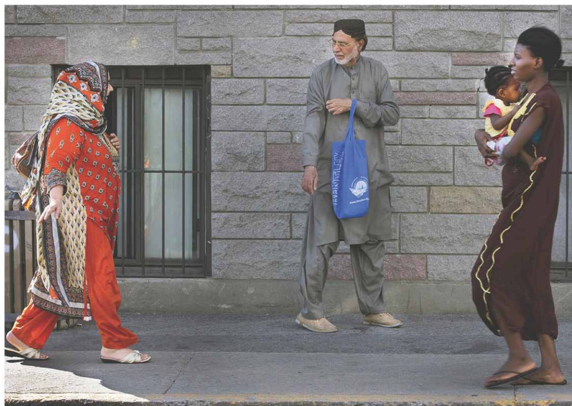
Les courants xénophobes ignorent l'intégration bien réussie de la majorité des immigrants.

Ceci est très noble. Mais défendre les droits des minorités d'une manière simpliste peut parfois avoir un effet pervers: un relativisme culturel qui ne fait que favoriser le conservatisme. Par exemple, je lutte fortement contre la discrimination dont sont victimes les femmes voilées, que certains veulent exclure de l'espace public au nom de leur libération. Je déplore le fait que les personnes d'origine musulmane qui s'affichent soient automatiquement considérées comme islamistes et suspectes. Je lutte également pour l'acceptation du pluralisme. Je fais également des efforts pour mettre en évidence la richesse de la diversité. Mais je ne fais jamais la promotion du hidjab ou du voile intégral, et