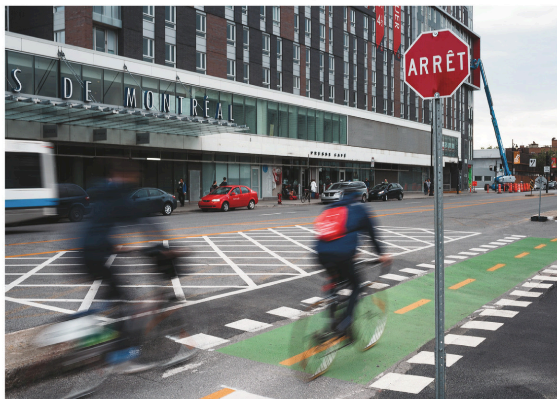
GUILLAUME LEVASSEUR LE DEVOIR

Les Québécois veulent des villes à échelle humaine où l'on peut se déplacer en toute sécurité, peut-on lire dans un rapport de la Société de l'assurance automobile du Québec.