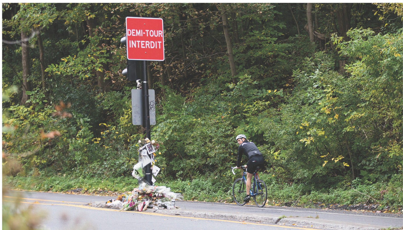
La Ville a fait installer des panneaux signalant l'interdiction d'effectuer des demi-tours sur la voie Camilien-Houde, à l'endroit où un jeune homme de 18 ans a été frappé par un automobiliste le 4 octobre dernier.

L'auto continue de régner chez nous comme si elle était coiffée d'un diadème. Jusqu'où cela peut-il aller? Au Texas, en 2008, on a doté Houston d'une autoroute de 26 voies, la Katy Freeway. Vous lisez bien: 26 voies. Plus de gens ont dès lors pris l'option de la voiture. Et ce réseau délirant se trouve désormais plus engorgé qu'avant sa construction! C'est pourquoi le «réalisme» qu'invoque Denis Coderre, avec une assurance plutôt grossière, n'est qu'une manière bien terre à terre de perdre de plus en plus contact avec le monde réel. On chercherait en vain de vrais espoirs dans ce cauchemar urbain nappé de sauce réaliste si personne ne sonnait enfin l'heure du réveil.