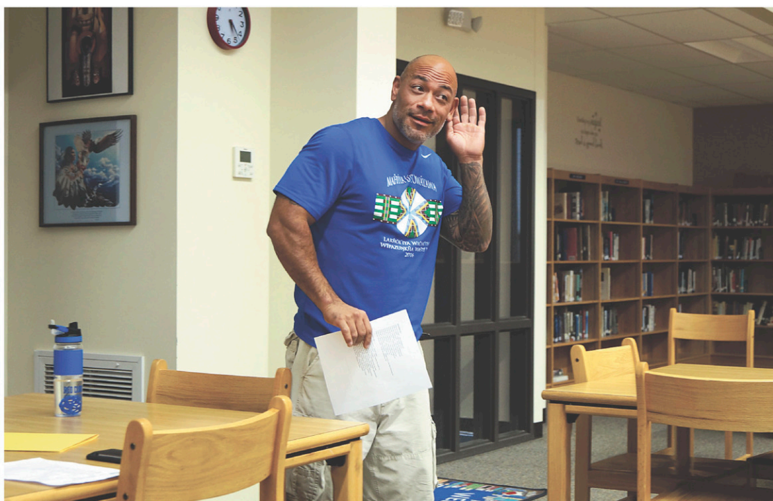
Un professeur enseigne des cours de lakota pour adultes les soirs de semaine dans la bibliothèque de l'école. Des enseignants de l'école et des parents d'élèves assistent à ces cours pour améliorer leur maîtrise de cette langue.

Les cours de langue lakota ont été développés en collaboration avec l'Université d'État d'Indiana. Les adolescents suivent trois ans et