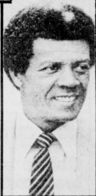
Maury Wills: tout un frappeur... de journaliste!

Que pense-t-il du stade? «Il y a de l'atmosphère. Chicago est une bonne ville de baseball. Et le stade est... intime.» Les Cubs doivent jouer sept matchs en soirée... 53 ans après le premier match disputé en soirée à Cincinnati. ●