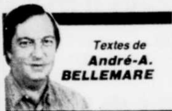
Textes de André-A. BELLEMARE

◆ Le ministère québécois de l'Énergie et des Ressources (MER) a averti bon nombre de propriétaires de chalets de la ZEC Owen (dans le Bas-Saint-Laurent) qu'il serait préférable pour eux de ne pas fréquenter le territoire, à compter de lundi prochain (le 1er août) et jusqu'au 15 septembre prochain, parce qu'on y procédera à des arrosages avec des produits chimiques... Juste au moment où la saison de pêche tire à sa fin et durant la période pendant laquelle les poissons se remettent à mordre! En plein durant la période pendant laquelle les truites se préparent à frayer! Exactement lorsque les chasseurs préparent leur territoire pour la saison de chasse des gros gibiers!