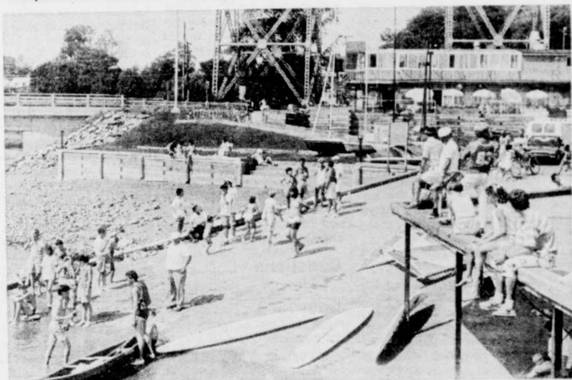
Les amateurs de voile et de ski nautique ont pu s'adonner à leur sport favori, tandis que les autres ont pris un malin plaisir à se promener sur l'eau en zodiac.