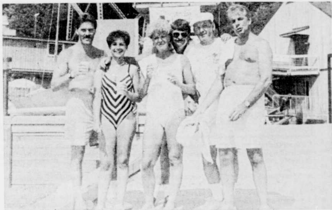
L'équipe du quotidien Le Soleil, toujours très dynamique, a animé avec brio ce bel après-midi passé à la Marina de Cap-Rouge.

Le samedi 23 juillet se déroulaient les activités à la MARINA DE CAP-ROUGE