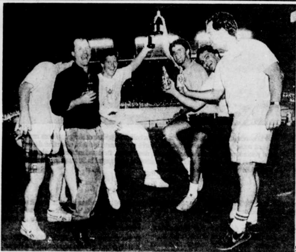
«Vive les Cubs en soirée», semblait le consensus de ces amateurs de baseball... et de bière, lundi soir, lorsque le Wrigley Field s'est illuminé pour la première fois.