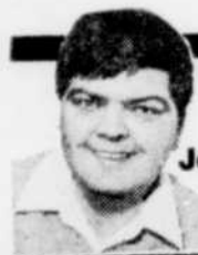
textes de Jean-François TARDIF

« J'ai contacté les autorités de Baseball-Québec et elles m'ont confirmé que les Ambassadeurs auraient pu avoir la permission d'aligner St-Pierre s'ils en avaient fait la demande au début de la campagne. Un simple coup de téléphone et tout aurait pu être réglé. On parle d'un joueur de 21 ans qui termine son stage chez les juniors. Il n'y a personne qui aurait été intéressé à lui mettre des bâtons dans les roues. » ●