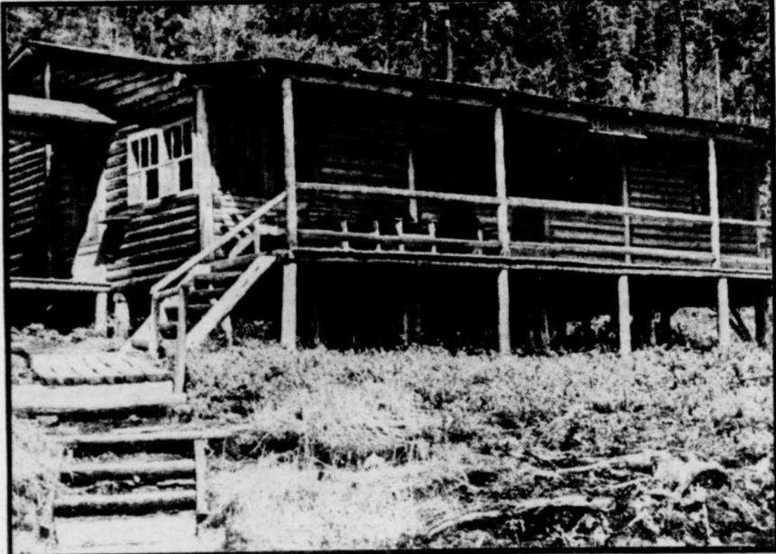
L'été, au Québec, est bien trop court. Il l'est encore plus quand le MER vous demande de ne pas aller à votre chalet en forêt parce qu'on y pulvérise des produits chimiques pour favoriser l'essor de l'industrie privée!

La ZEC Owen, d'une superficie de 615 km 2 , est située immédiatement au sud-ouest de la réserve faunique gouvernementale de Rimouski (près du grand