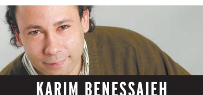
KARIM BENESSAÏEH LES ARTÈRES DE MONTRÉAL

La rue Sainte-Anne, petite artère au cachet villageois longeant le lac Saint-Louis à Sainte-Anne-de-Bellevue, est devenue une destination touristique en soi. Coquette, la rue est désormais tellement tournée vers ses visiteurs estivaux que les résidents s'inquiètent maintenant de ce qu'il adviendra de leur «village» durant les autres saisons. Dans le 4 e volet de notre série sur les artères commerciales de Montréal, regard sur les bons et les mauvais côtés des rues touristiques.