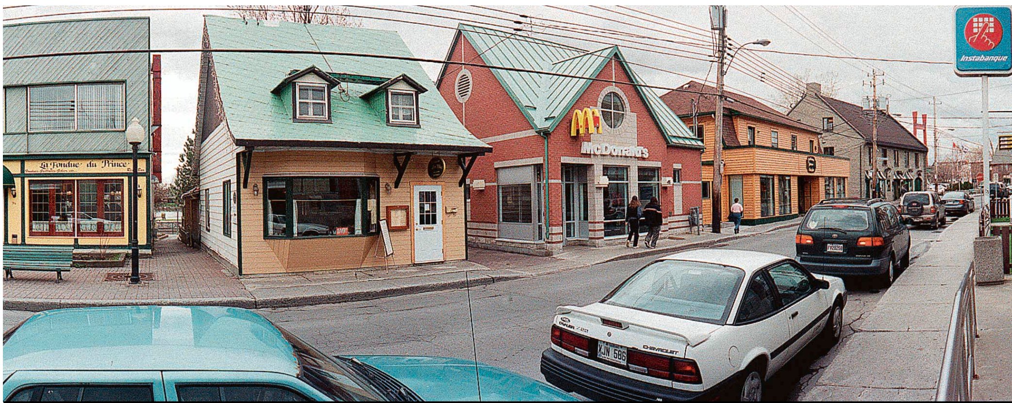
La transformation touristique de la rue Sainte-Anne à Sainte-Anne-de-Bellevue a commencé en 1985, quand on a rénové et agrandi la promenade au bord du fleuve. Le succès a été rapide, mais a chamboulé l'artère commerciale.

LE TOURISME À DEUX TRANCHANTS DANS L'OUEST-DE-L'ÎLE