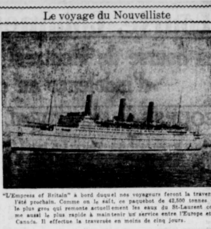
"L'Empress of Britain" à bord duquel nos voyageurs feront la traversée l'été prochain. Comme on le sait, ce paquebot de 42,500 tonnes est le plus gros qui remonte actuellement les eaux du St-Laurent comme aussi le plus rapide à maintenir un service entre l'Europe et le Canada. Il effectue la traversée en moins de cinq jours.