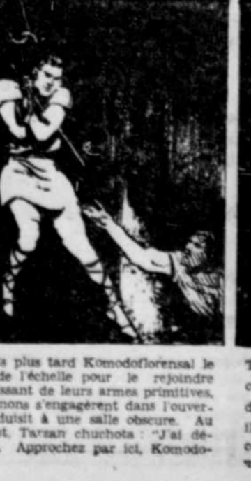
Tarzan se laisse glisser lentement et avec précaution le long de l'échelle qu'il avait fabriquée avec les barreaux. Pendant qu'il descendait, les deux compagnons s'engageaient l'un avec l'autre dans une lutte acharnée. Tout d'un instant, Tarzan chuchota: 'J'ai découvert la porte. Approchez par ici, Komodogorensi.'