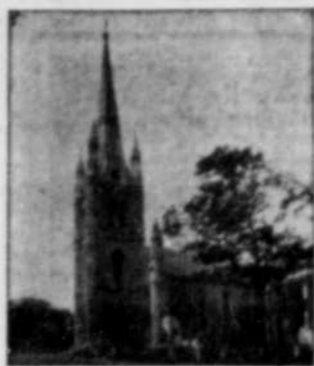
Voici la solution du casse-tête paru dans Le Nouvelliste de samedi dernier.