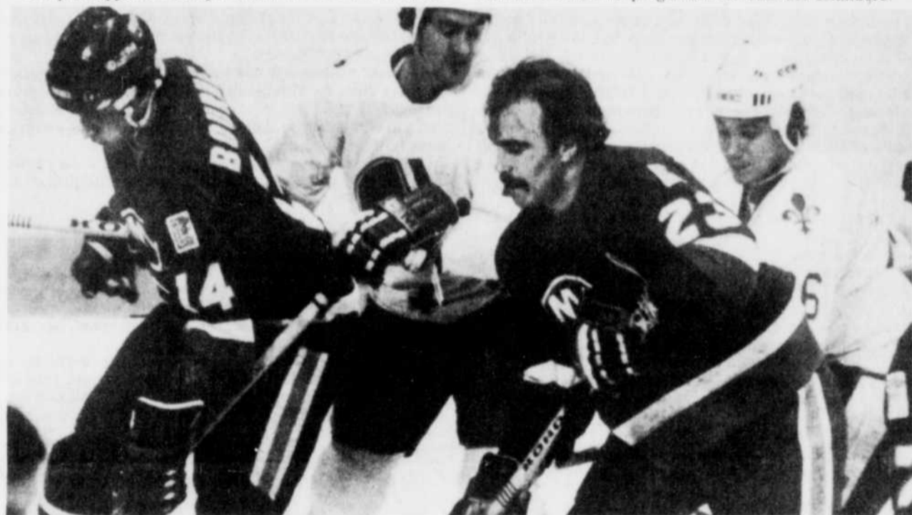
Les Nordiques de Québec en ont eu plein les bras face aux Islanders de New York, mais ils ne sont pas au bout de leurs peines.

Hogosta a fait face à un bombardement de 50 tirs tandis que les Nordiques n'en ont dirigé que 29 vers Glenn Resch, qui gardait les buts des Islanders.