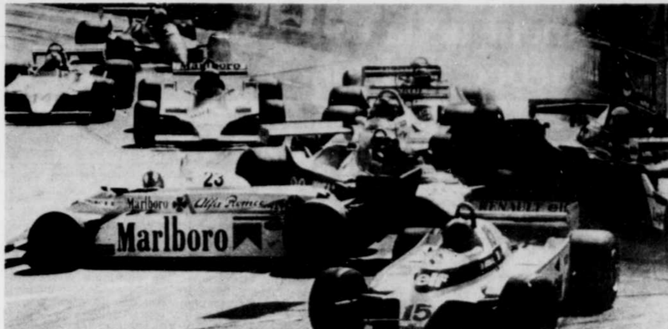
Un accident impliquant six voitures a causé tout un émoi au Grand Prix de Long Beach. C'est en dérapant que Bruno Giacomelli, conducteur de la voiture numéro 23, a causé ce carambolage.

Match dénué de rudesse avec aucun but et une seule pénalité en troisième.