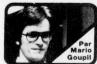
Par Mario Goupil

SHERBROOKE — Une histoire d'amour à faire fondre en larmes les êtres les plus durs de cette terre. Une histoire d'amour qui a atteint son paroxysme samedi à l'occasion de "l'encan du bonheur" tenu dans le hall d'entrée du Palais des Sports.