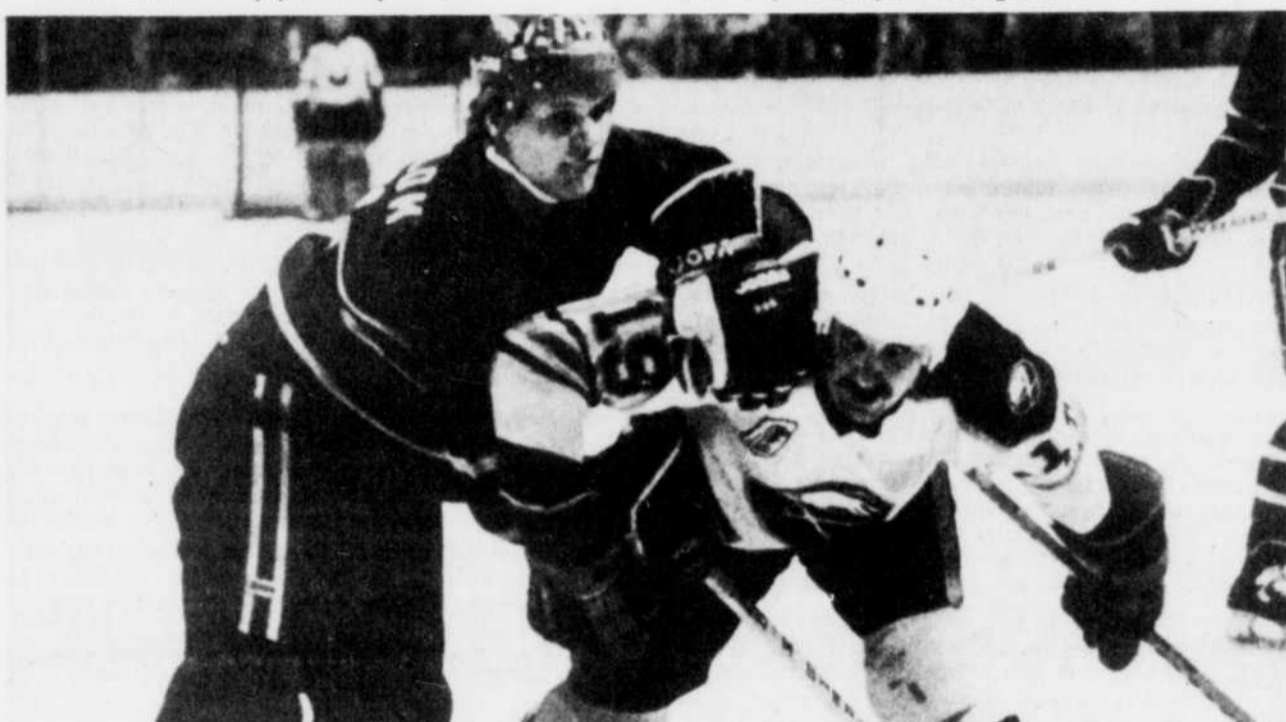
Les Canadiens de Montréal se sont accrochés aux Sabres de Buffalo et au deuxième rang du classement général.

Ce triomphe permet aux Flyers de totaliser 113 points jusqu'ici cette saison, ce qui leur vaut le championnat au classement général de même que le privilège de commencer toutes les rondes des séries de la coupe Stanley sur leur glace.