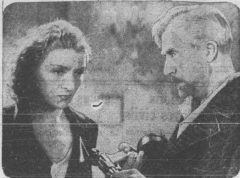
La pathétique et si brillante artiste Vera Korène et Victor Francen dans un moment du film "Double crime sur la ligne Maginot", aujourd'hui au théâtre Saint-Denis.