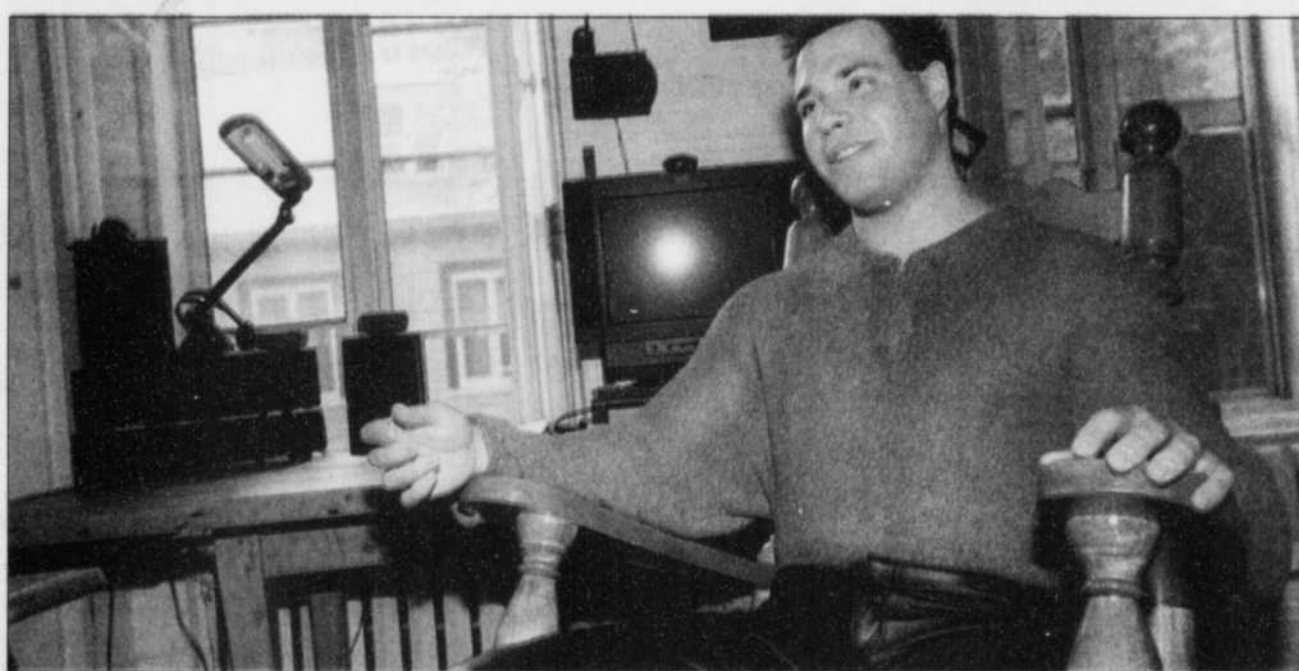
L'an dernier, il a confondu l'université Laval en décrochant un bac en physique en une année seulement.