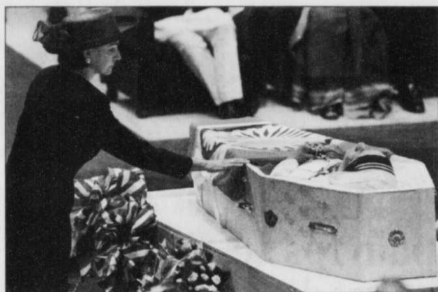
Aline Chrétien, épouse du premier ministre Jean Chrétien, représentait les Canadiens. Elle est allée se recueillir devant Mère Teresa pendant les obsèques.