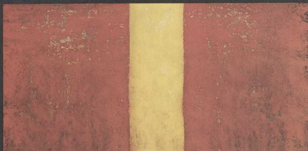
"Éclat de gaieté verte" Huile de Jean McEwen