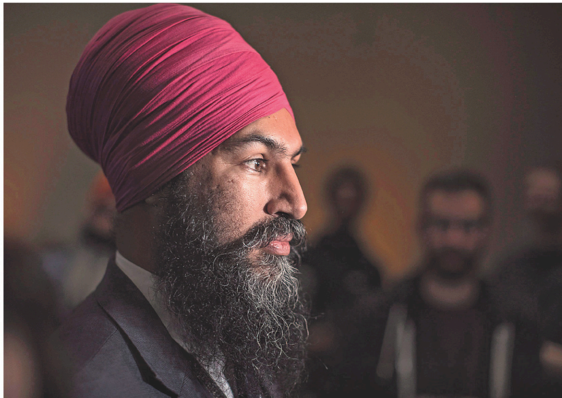
Le nouveau chef du NPD, Jagmeet Singh, a réitéré sa conviction que les tribunaux invalideront le projet de loi 62 au nom du respect des chartes des droits et libertés.

«Je respecte la juridiction du Québec, mais en même temps, c'est à moi de dire ma position sur les lois. Si un gouvernement, une nation veut privatiser quelque chose, c'est à moi comme néodémocrate de dire non, je ne pense pas que cela profitera aux gens. Alors de la même façon si quelque chose brime les droits de la personne, c'est à moi de dire non, je ne suis pas d'accord.»