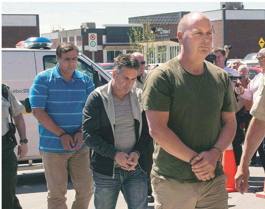
RYAN REMIÖRZ LA PRESSE CANADIENNE

Le jury de 14 membres a commencé à entendre la preuve