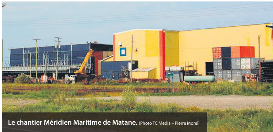
Le chantier Méridien Maritime de Matane.

JEAN-PHILIPPE THIBAUT - PIERRE MOREL gas.redaction@tc.tc