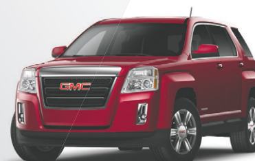
TERRAIN SLE-1 À TI 2015

COTE DE SÉCURITÉ GLOBALE 5 ÉTOILES DE LA NHTSA 3