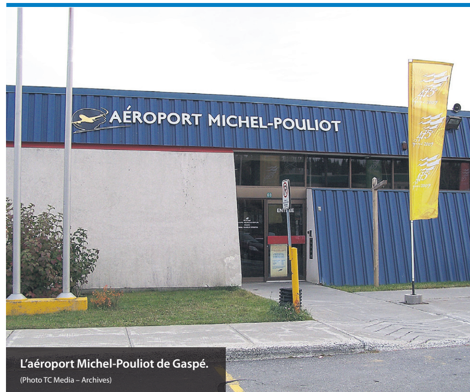
L'aéroport Michel-Pouliot de Gaspé.