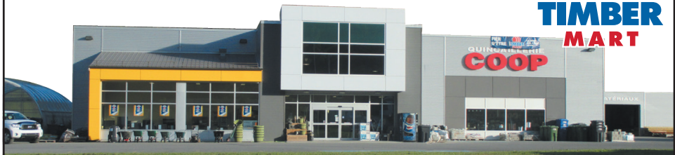
309, Montée Morris, Rivière-au-Renard GASPÉ • 418 269-3308