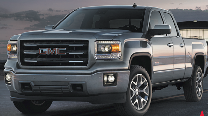
SIERRA 1500 À CABINE DOUBLE 1SA 2015

CHOIX SÉCURITAIRE PAR EXCELLENCE SELON L'IIHS 2015