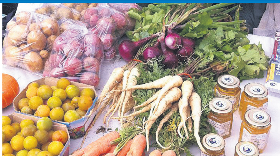
Sept producteurs et transformateurs locaux et un artisan ont vendu leurs produits dimanche dernier.

Plusieurs clients rencontrés sur place ont d'ailleurs profité de l'occasion pour poser leurs questions aux producteurs. Les prochains marchés se tiendront le 30 août ainsi que le 12 septembre à la pointe O'hara, et en conclusion le 20 septembre sur la rue de la Reine.