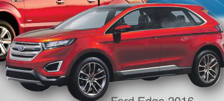
Ford Edge 2016

*En cas de pluie, l'activité aura lieu quand même.