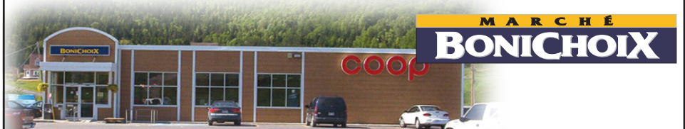
48, Montée Morris, Rivière-au-Renard GASPÉ • 418 269-3300