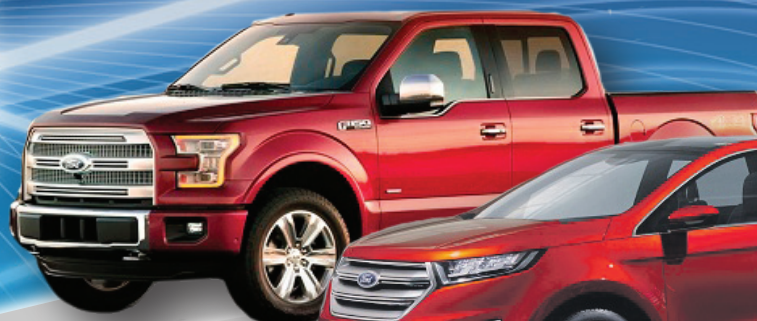
Ford F-150 2016

OBJECTIF 6000,00 $ 300 ESSAIS ROUTIERS X 20,00 $