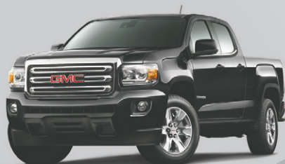
CANYON SLE 4X2 2015