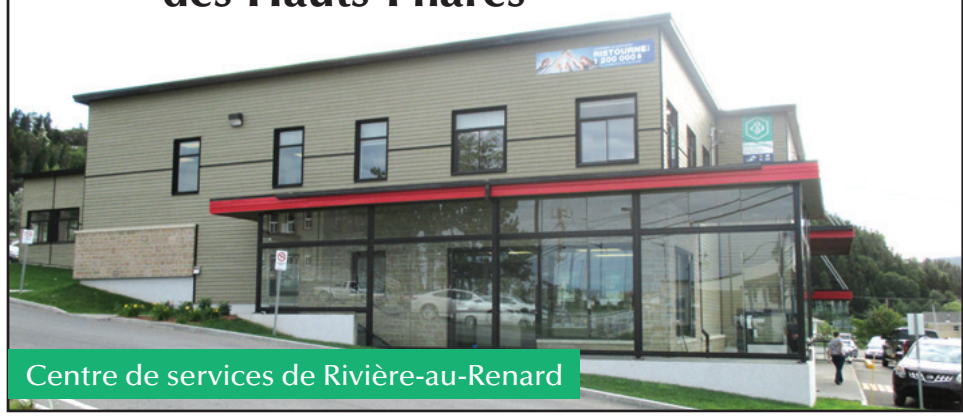
Centre de services de Rivière-au-Renard

80-1, Montée Morris, Rivière-au-Renard Tél. : 269-3305