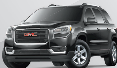
TOUS LES MODÈLES ACADIA 2015