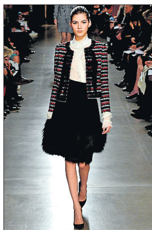
Oscar De La Renta