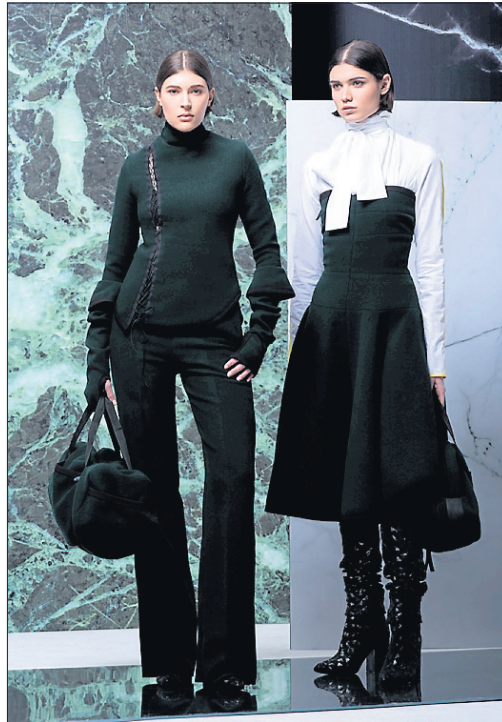
Sa collection automne-hiver 2015-2016 table principalement sur le noir et blanc.

Mais le créateur ne s'arrête pas là. Il se retire momentanément de l'industrie pour se consacrer à la création de sculptures mouvantes. Il revient en force au printemps 2008 avec un défilé acclamé par le Tout-Montréal branché. Ses présentations font salle comble et ses collections sont encensés. Le