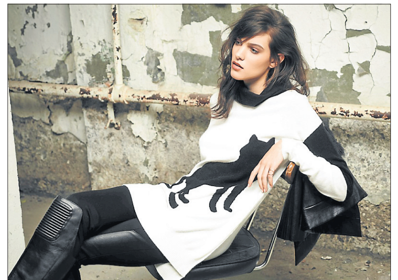
Le noir et blanc domine la mode d'automne 2015 sous la griffe de Mélissa Nepton.

À chaque tour sur la passerelle, Mélissa Nepton innove et précise sa signature. Sous des thèmes de voyages imaginaires où sont présentées des vêtements aux tissus riches et vaporeux et aux coupes impeccables, les collections de Mélissa Nepton se retrouvent dans un nombre grandissant de boutiques.