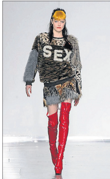
Le grand retour des bottes cuissardes, selon Ashish.

encore en mémoire les cuissardes et les chandails jacquard des années 70 ? Peut-être aussi du style marin des années 80 ? L'inspiration est donnée, c'est un peu le retour vers le futur.