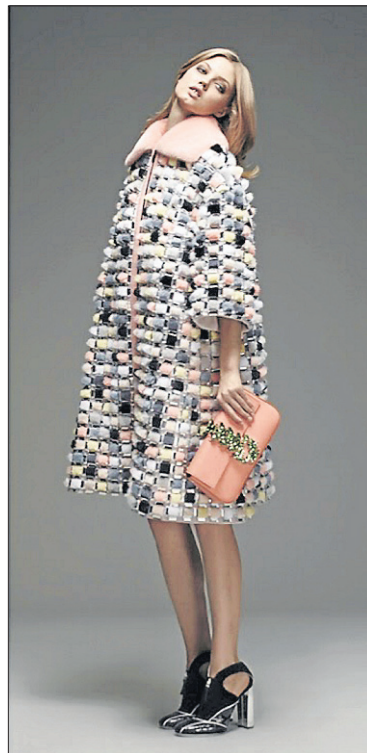
C'est aussi le retour des manteaux longs pour un hiver au chaud avec Fendi.