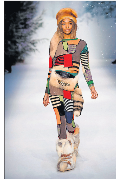
Patchwork et fourrure, l'hiver selon Moschino.

tablent sur le vinyle. Chloé et Lanvin reviennent à la laine. Dior, Saint-Laurent et Hermès proposent le rouge alors que le violet ressort chez Balmain et Charlier. Pour Victoria Beckham et BCBG, la préférence va au beige. Max Azria ressort les cuissardes, Dior et Prada ont retrouvé la tendance gants, Diane Von Furstenberg retrouve l'importance de la ceinture. Le rouge et le noir se retrouvent sur presque tous les podiums, c'est la tendance la plus in-