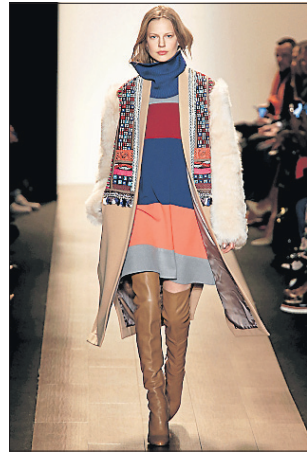
BCBG Max Azria