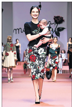
Dolce & Gabbana