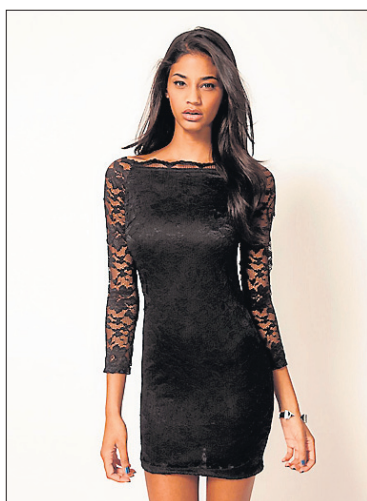
La «petite robe noire», indispensable à toute garde robe.

«La petite robe noire» s'impose comme synonyme de liberté, mais aussi d'élégance. Coco Chanel est la première à reconnaître que le noir n'a, en fait, rien de triste. Certes, c'est la couleur du deuil et donc celle des veuves, mais elle possède