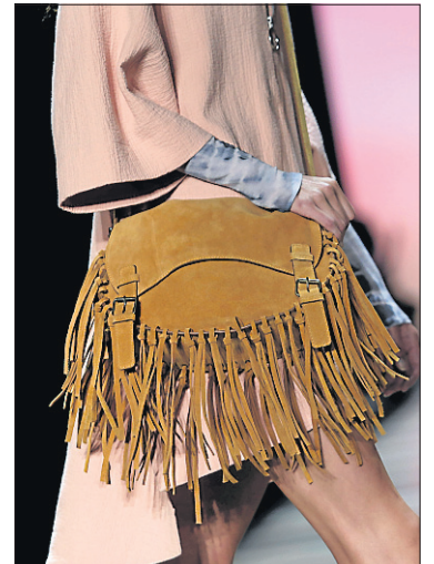
Les franges sont aussi de mise cet automne chez BCBG Max Azria.

Pour les plus excentriques, sachez que les mannequins défilaient avec des blouses ultra transparentes dévoilant leur poitrine, arboraient des chaussures en fourrure, de gros bijoux clinquants. Les vêtements grunge à gros carreaux, les manteaux longs, les capes, les manches vraiment trop longues ont aussi fait leur effet sur les passerelles. En terminant, un petit secret tendance chez Balmain et Dior : ne portez qu'une seule boucle d'oreille, mais volumineuse et voyante.