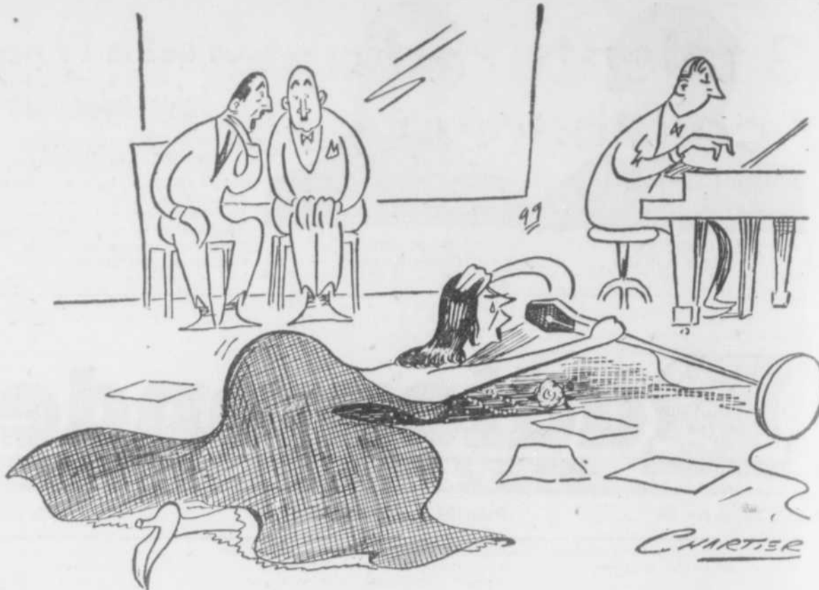
« Elle chante un peu à la manière d'ESTELLE CARON — Elle y met de l'âme! »