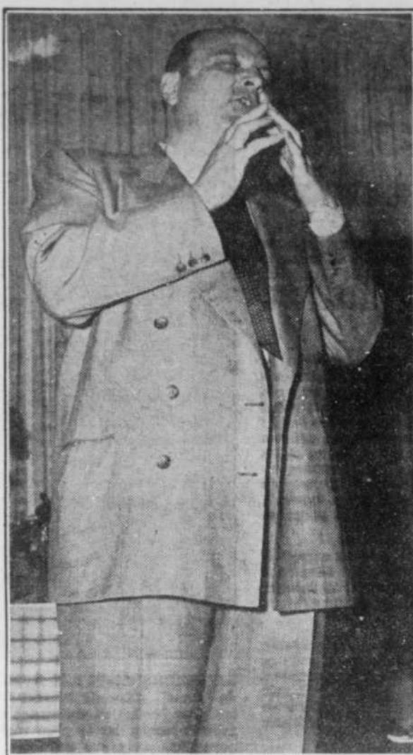
"Le 'je' est prétentieux..."

Au lieu de lui monter à la tête, les succès ont rendu Norbert timide. A l'instar de plusieurs célébrités du théâtre, No-No n'a pas très confiance en lui. Il se redoute et se surveille de près.