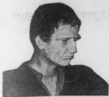
FRANKENSTEIN (Pierre Valcour)