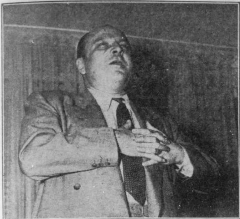
"Tout le monde est gentil..."