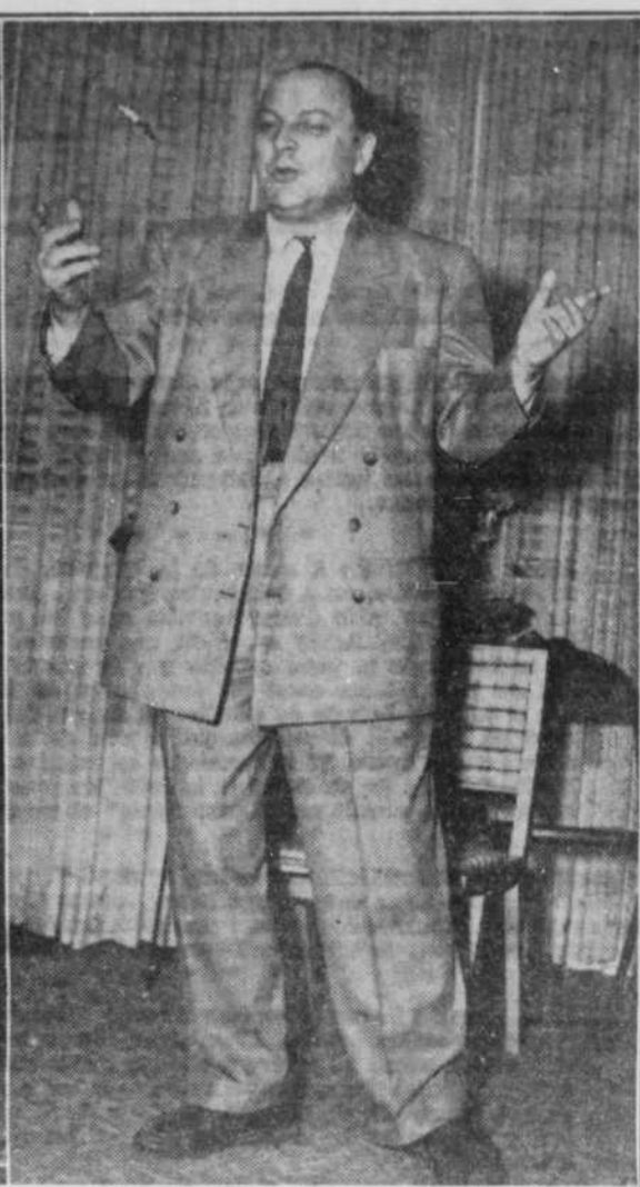
"Il est mieux de parler des autres..."

Il avoue n'être jamais allé aux Etats-Unis. D'abord parce qu'il n'a pas eu l'occasion. Ensuite, parce qu'il ne dit pas un seul mot d'anglais. Il est quand même bilingue, puisqu'il parle l'espagnol correctement.