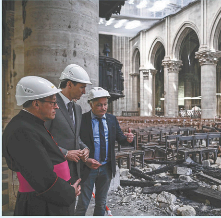
Justin Trudeau (au centre) à Notre-Dame de Paris