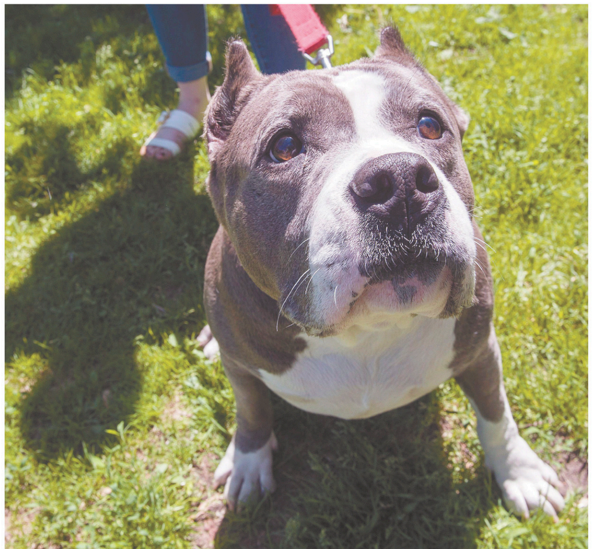
Dans les lieux publics, les animaux de 20 kg et plus devront porter, en tout temps, un licou ou un harnais.

À l'heure actuelle, environ la moitié des municipalités du Québec ont des règlements encadrant les chiens dangereux. Ce projet de règlement vient