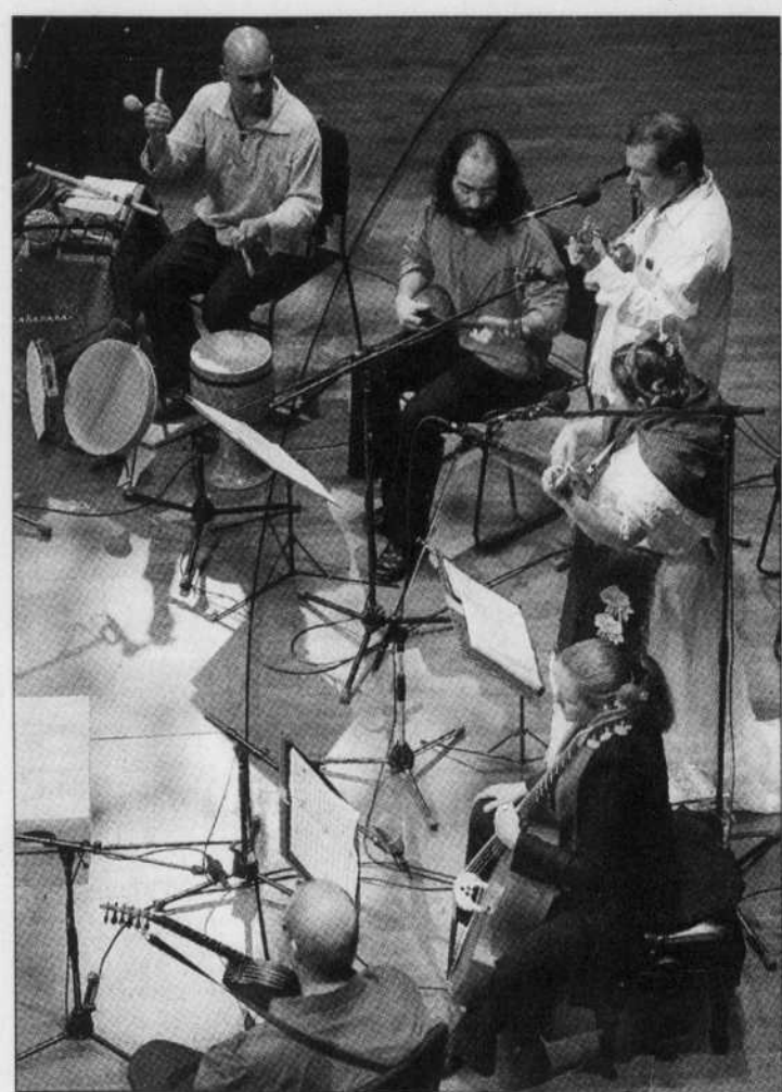
L'ensemble montréalais Constantinople célèbre ses cinq ans cette année.