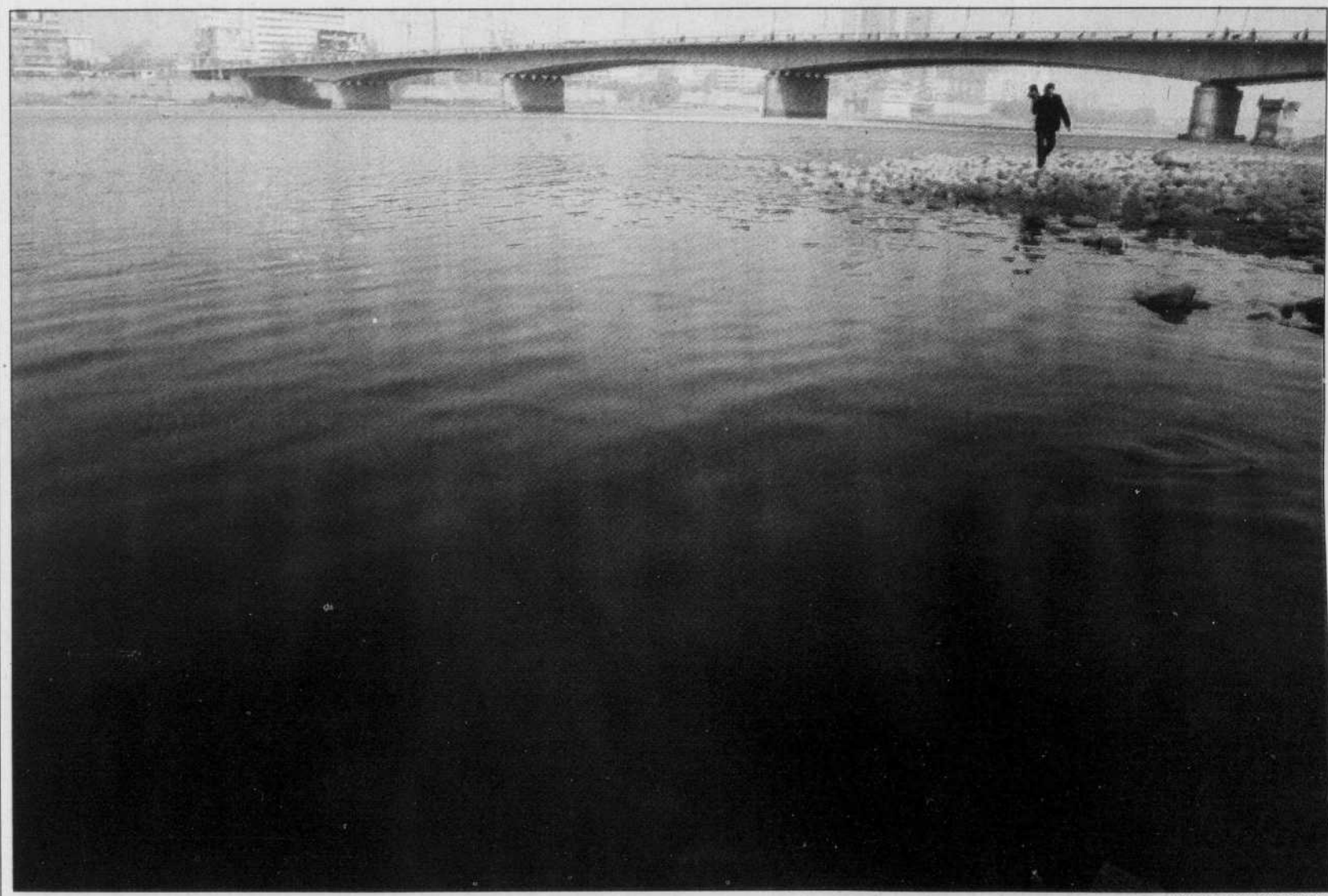
Le fleuve Jaune, près de la ville de Lanzhou, en Chine, est maintenant pourpre en raison de la pollution. Si l'opinion publique se révèle favorable à la mondialisation, elle estime toutefois que ses conséquences sur l'environnement sont néfastes.