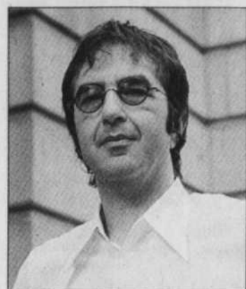
JACQUES GRENIER LE DEVOIR

Exemple de cet intérêt: hier, le quotidien Libération consacrait une pleine page non pas à Egoyan mais à Guy Maddin, «l'agité de Winnipeg», à la faveur