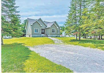
11476268 Sise sur un grand et superbe terrain boisé de 30 000 pi.ca., 4 CAC. Vous avez devant vous la maison parfaite! Inf.: Pascal Milotte