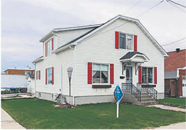
18400913 Chaleureuse et familiale, 6 chambres, 1 garage. Inf.: Nancy Duval