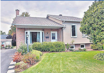
25865534 Beau bungalow, bien rénové, possibilité de 4 chambres, terrain intime. Inf.: Daniel / Mélissa