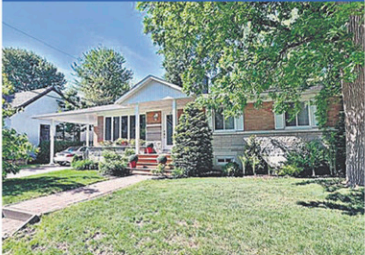
17267230 Belle arrière 4 saisons, BCQ de luminosité, 5 CAC, terrain intime. Inf.: Jasmine ou Pierre-Luc