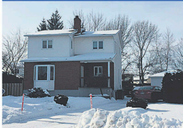
16292092 Ste-Rosalie, terrain 8 675 pi.ca., 4 CAC. Inf.: Maryse ou Guylaine