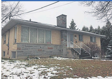
18926062 Près du Cégep, secteur facile de location, garage. Inf.: Pierrette