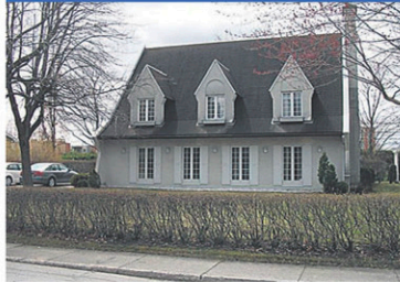
9697787 Magnifique maison à proximité de tous les services. Inf.: Pierre Solis