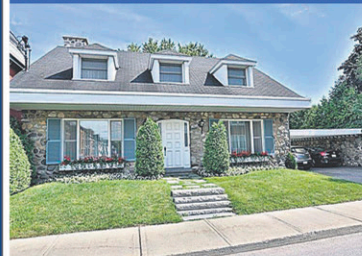
19876909 Magnifique propriété 4 CAC, 4 SDB, sise sur un terrain de 17 000 pc. aux abords de la rivière Yamaska. Inf.: Pierre Solis