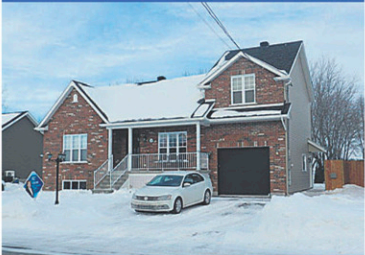
24112423 St-Simon, 6 CAC, à quelques minutes de l'A-20. Inf.: Maryse ou Guylaine