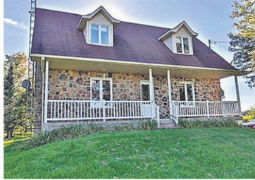
12869604 Cette maison vous offre de l'espace mur à mur et 5 chambres à coucher! Idéale pour grande famille, 249 000 $. Inf.: Equipe PJM