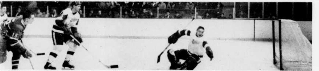
Les fervents de hockey s'en donnent à cœur joie durant les parties finales en vue de l'obtention de la Coupe Stanley, puisque toutes ces parties sont diffusées à la radio et à la télévision.