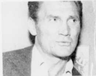
Jack Palance est le héros des "Intrépides", le dimanche soir de 7 h. 30 à 8 h. 30.