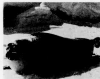
Dimanche soir à 10 heures, "Des phoques et des hommes", reportage de Ierge Deyglun.