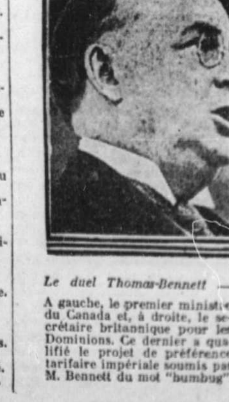
Le duel Thomas-Bennett — A gauche, le premier ministre du Canada et, à droite, le secrétaire britannique pour les Dominions. Ce dernier a qualifié le projet de préférence tarifaire impériale soumis par M. Bennett du mot "bumbug".

Les Chevaliers de Colomb du Conseil Verduin No 1751, sont convoqués à une assemblée spéciale qui aura lieu vendredi le 5 à 9 heures.