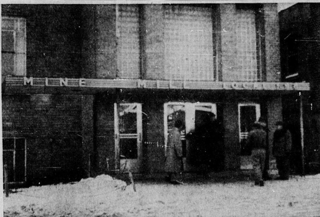
A L'EXTERIEUR DES BUREAUX — On voit ici quel calme régnait à l'extérieur d'un bureau de scrutin, mardi, à Sudbury, où les membres du syndicat des mines, raffineries et hauts-fourneaux allaient voter pour un nouvel exécutif. Des gens, à l'extérieur, attendaient de voter pour le communiste Thibault, Gillis a aussi envoyé de ses hommes pour contrebalancer la propagande.