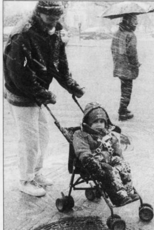
JACQUES GRENIER LE DEVOIR

DÉCIDÉMENT , les soubresauts de l'hiver n'en finissent plus de blanchir la ville! Un dimanche de printemps a pris hier des allures de Noël alors que les Montréalais tentaient tant bien que mal d'affronter la neige qui s'abattait sur leurs têtes abasourdies.