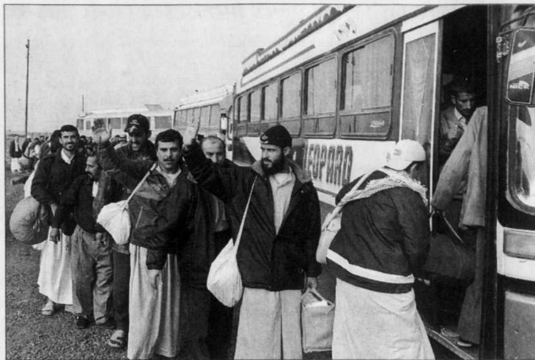
Des prisonniers ont été relâchés hier de la prison Abou Ghraïb.

«Après les élections, les attentats terroristes et les attaques ne s'arrête-