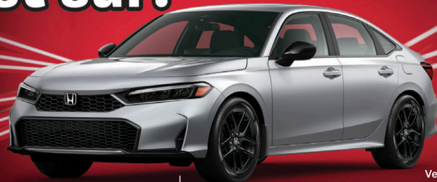
Version Sport hybride illustrée

Encore meilleure en version hybride. C'est sûr.