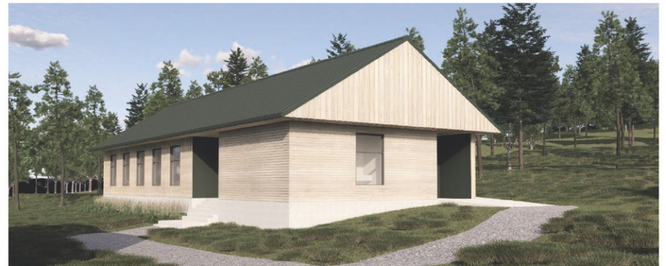
Le bâtiment multiservice pourrait ouvrir dès l'été 2025.

Le bâtiment multiservice que planifie construire CIME aura pour principales fonctions