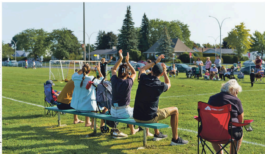
Des parents sont venus encourager les jeunes tout au long de la journée.