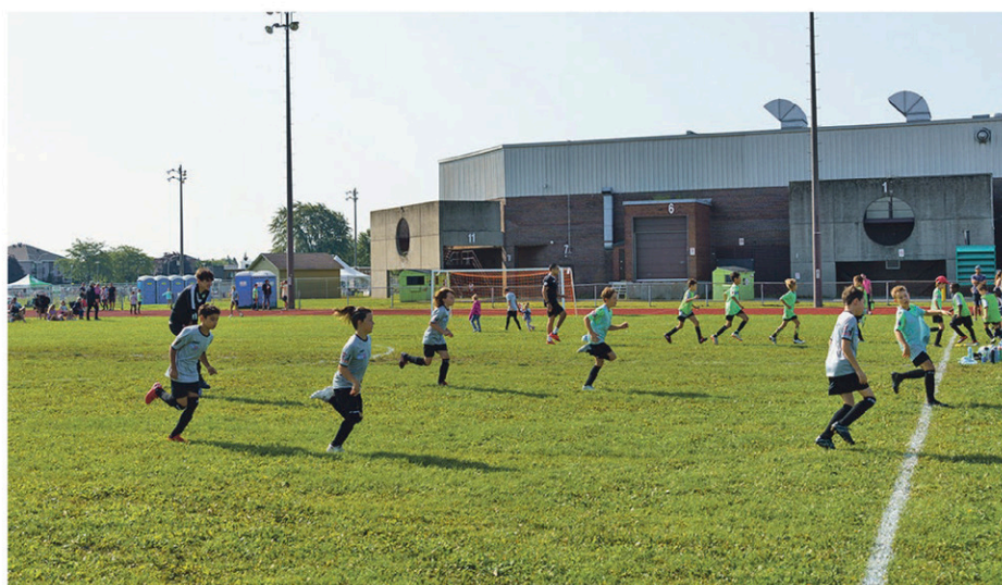
Le Celtix du Haut-Richelieu organisait sa fête annuelle le 24 août dernier sur les terrains du Complexe sportif Claude-Raymond.