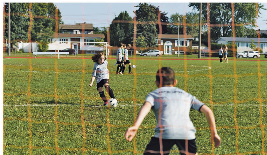
Matchs, jeux et animation étaient au programmes de cette dernière rencontre de la saison.