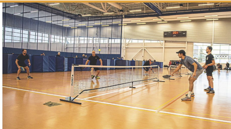
La première manche du Circuit québécois de pickleball avait eu lieu en janvier 2024 à la garnison Saint-Jean.

Le club de golf Miner propose un parcours de neuf trous avec des normales 3, 4 et 5. « Nos athlètes en étaient à leur première expérience sur un vrai terrain et par le fait même, une première participation à un Championnat. Ils ont tous apprécié cette épreuve », indique M me Prince.