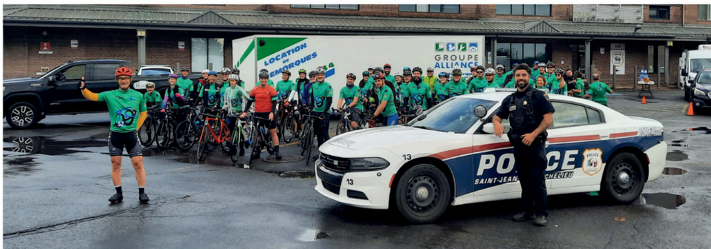
Les cyclistes de la Randonnée du Souvenir Thierry-Leroux se sont réunis dans le stationnement du Service de poste de police de Saint-Jean-sur-Richelieu pour prendre le départ de cette septième édition.