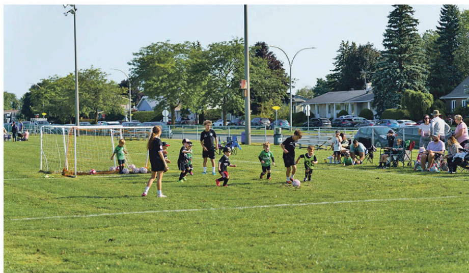
Les jeunes ont eu l'occasion de disputer leurs derniers matchs de la saison.