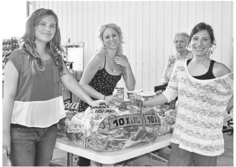
Quelques bénévoles en action lors de la préparation des Paniers de la rentrée.

La Fondation Rock-Guertin fait partie d'un réseau de partenaires appuyant la réussite des élèves de la CSRS, chacun à sa façon. Par exemple, un organisme s'occupe d'offrir un sac à dos bien rempli à certains élèves, d'autres habillent les enfants pour l'hiver, etc. « La mission d'une école est d'instruire les jeunes, de leur permettre de socialiser et de leur offrir un milieu de vie sain et sécuritaire. Mais si les besoins de base de nos élèves ne sont pas comblés, comme manger bien et à leur faim, il est difficile pour eux de passer à un autre niveau et d'être réceptifs aux apprentissages. Grâce à des partenaires comme la Fondation Rock-Guertin, nous