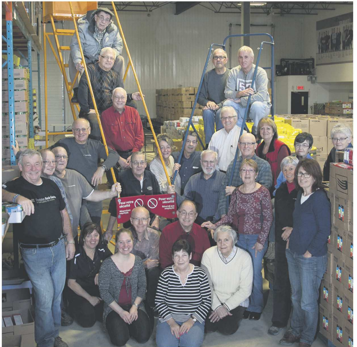
Une partie des bénévoles œuvrant durant le blitz du Panier de l'Espoir dans l'entrepôt de la Fondation Rock-Guertin.