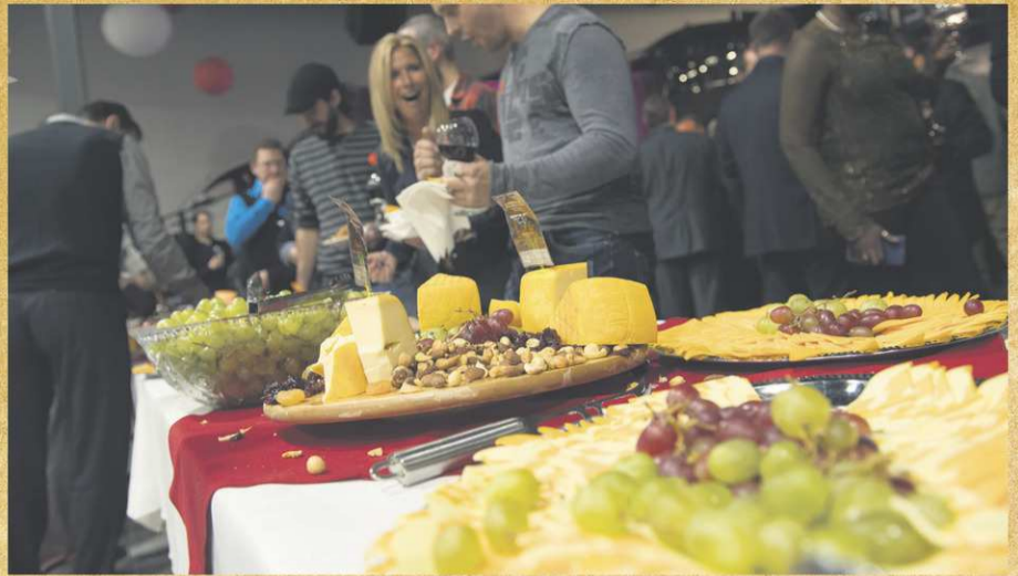
Les participants ont pu déguster d'excellents vins et fromages tout au long de la soirée.