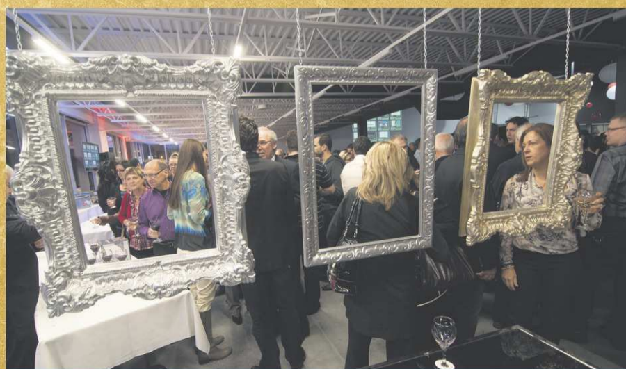
Hôte pour la première fois de cet événement, le garage Occasion Beaucage s'était fait une beauté pour accueillir en grand des centaines de gens.