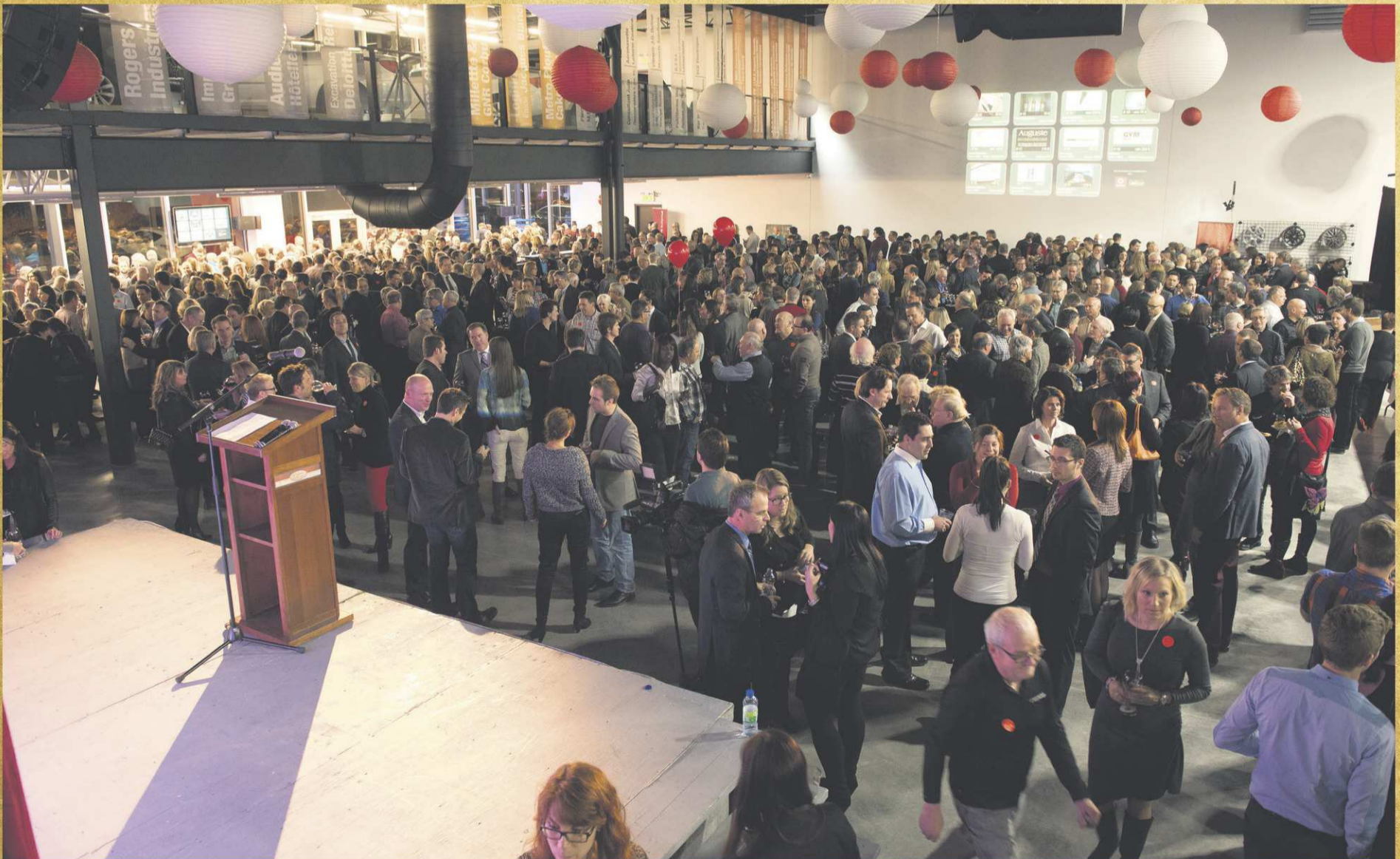
Les lieux étaient remplis à craquer comme en témoigne bien cette photo prise lors de cette belle soirée où générosité et bonne humeur étaient au rendez-vous.