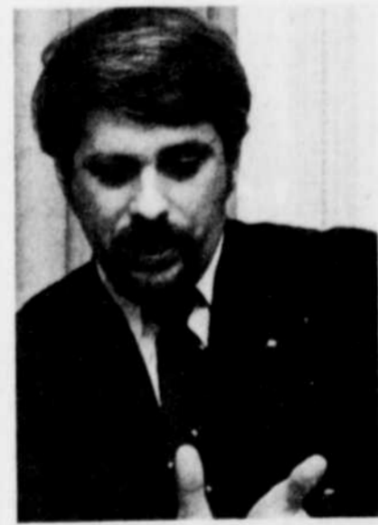
M. Pierre-Marc Johnson