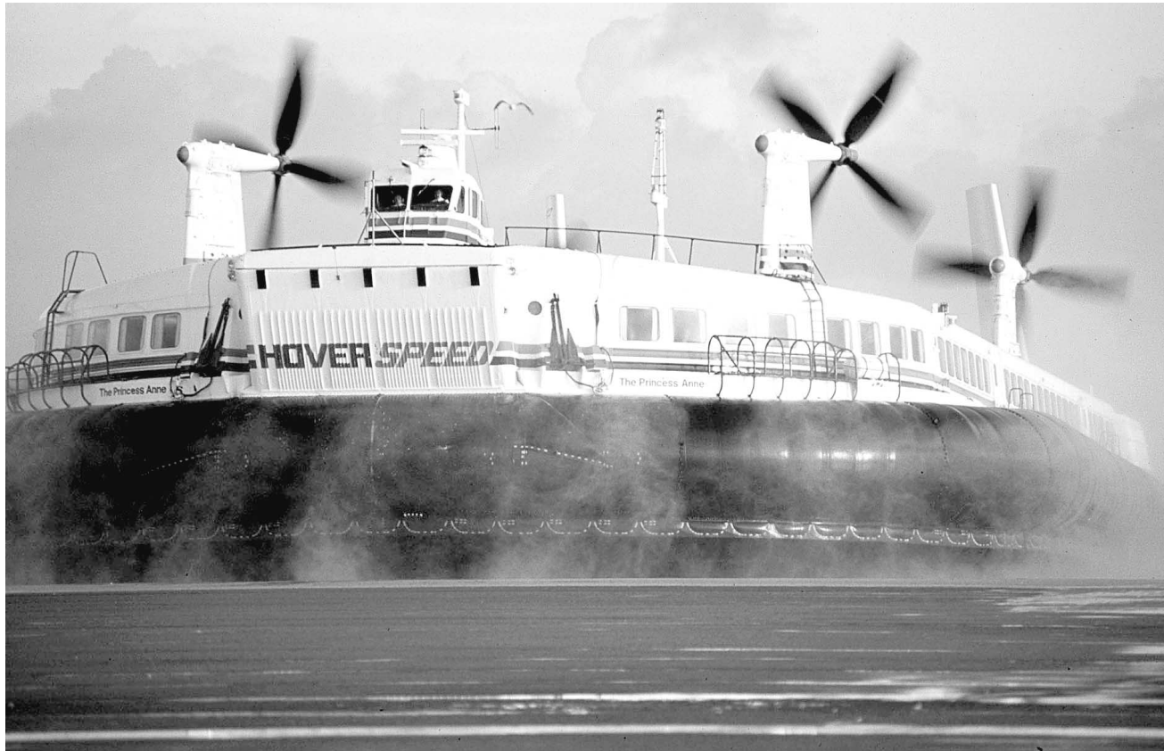
Les navires à grande vitesse d'HoverSpeed sont deux fois plus rapides que les ferries traditionnels. Les traversées se font en 45 minutes, plutôt que 90.

Les salons du Revoir (1650 passagers, 280 voitures), le navire le plus récemment réaménagé de la flotte SeaFrance, qui aligne trois ferries sur Calais-Douvres avec le Cézanne et le Manet , en offrent ainsi pour tous les styles. « Les posés s'installent à l'arrière, tandis que ceux qui aiment bouger investissent l'avant », observe le commis-