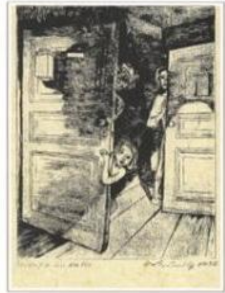
Neuf de l'école des loisirs

racontée du point de vue d'Annemarie et non d'Ellen. La plupart des histoires concernant le règne nazi placent le Juif comme narrateur ou personnage principal, mais, dans ce cas, on voit à travers les yeux d'un jeune Danoise, ce qui est très original.