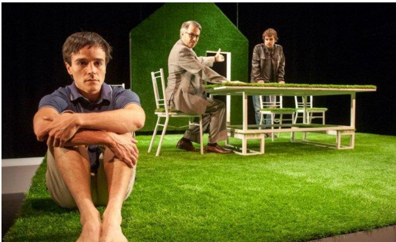
Visage de feu se veut une véritable et abrasive critique de la famille nucléaire contemporaine.

Après cinq minutes de jeu, Olga enlève sa blouse blanche. La jeune fille, cherchant à s'émanciper de sa vie morne à travers la libération sexuelle, entraînera vite son petit frère, Kurt, avec elle dans une quête qui tournera vite au malsain. Les scènes d'inceste entre les deux enfants — relevant d'abord de l'expérimentation, puis devenant explicitement sexuelles — choquent immédiatement par leur brutalité crue. Après quelque temps cependant, Kurt, de plus en plus négligé par sa sœur au profit de l'amoureux de celle-ci, se voit dans l'incapacité d'assouvir les pulsions de sa sexualité naissante, et sombre lentement mais inexorablement dans une démence violente. Un chat brûlé, une attitude taciturne exacerbée par les bouleversements de son entourage engendreront un masque de poudre