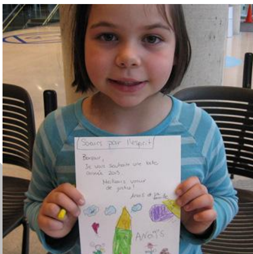
Marathon d'écriture de 2012

Pour la description de tous les cas, visitez la page d'Amnistie Internationale : http://www.amnistie.ca/site/cartes-voeux/index.php