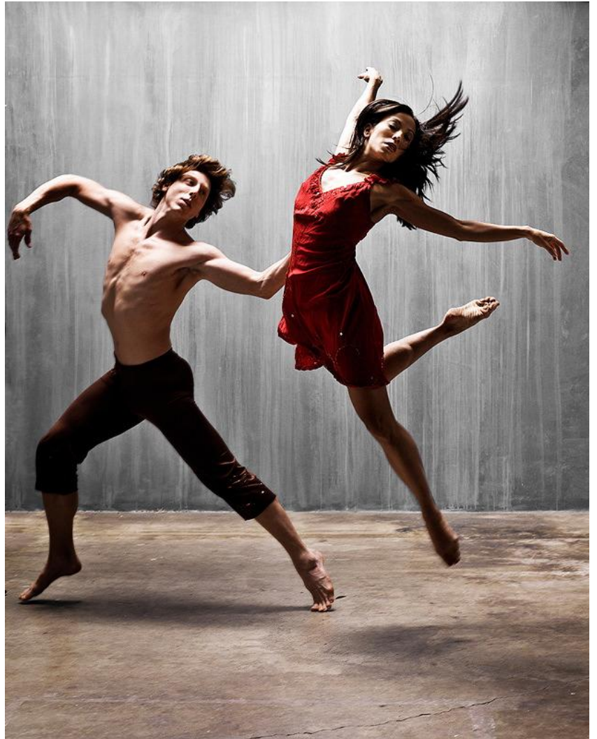
Un couple de danseurs modernes

Arrivés à destination : Silence! Le public applaudit.