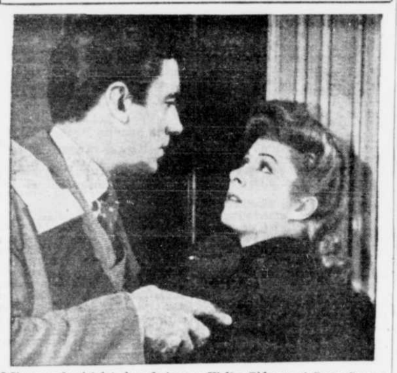
Un coup de pistolet glace de terreur Walter Pidgeon et Greer Garson, dans une scène de "Blossoms in the Dust", présenté au Granada à partir de demain, en programme double avec Maureen O'Hara et James Ellison, dans "They Met in Argentina".