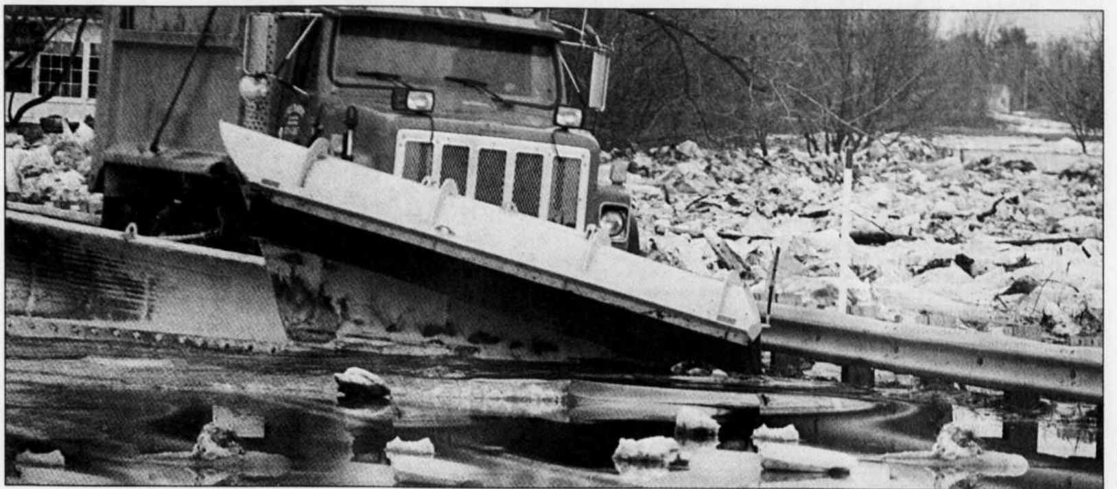
Chasse-neige ou chasse-eau? À Huntingdon, c'est surtout de l'eau que poussait la déneigeuse hier après-midi. Quelque 200 résidents de la petite municipalité se tenaient prêts à être évacués, repoussés par les eaux montantes de la rivière Châteauguay. La pluie devrait reprendre cette nuit et se poursuivre toute la matinée.