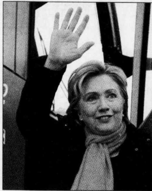
Hillary Clinton saluant ses partisans à Nashua, au New Hampshire, hier.

Après le New Hampshire, la prochaine grande pri-