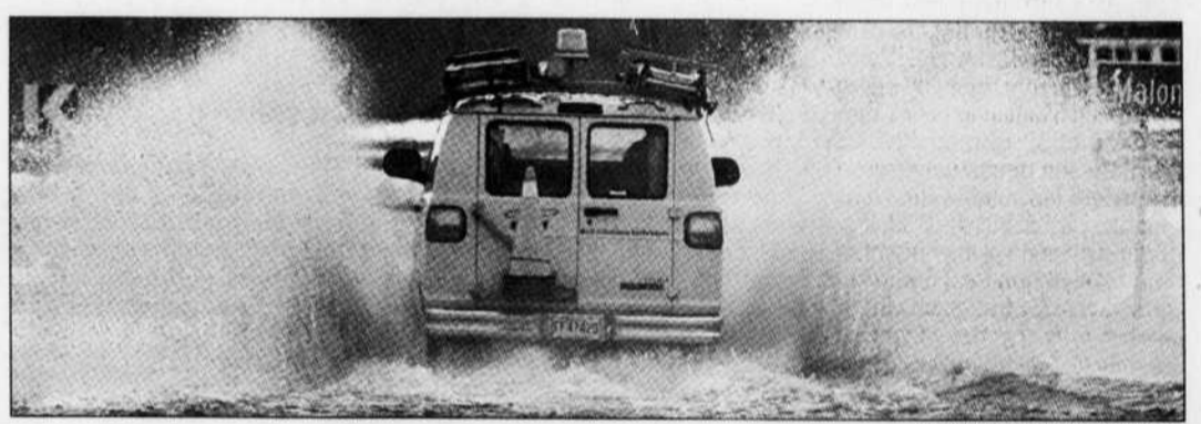
Quand les routes n'étaient pas fermées à la circulation, hier, elles étaient souvent difficilement praticables, comme à Malone, près de la frontière américaine.

Hier après-midi, la route 138 était d'ailleurs fermée à la circulation sur plusieurs kilomètres. La rivière Châteauguay a également débordé, inondant une autre route qui mène à la frontière.