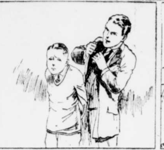
Mais, jamais une surprise à faire à Dick, et je ne pus m'empêcher de sourire en lui voyant les yeux prêts à pleurer. J'avais envoyé un télégramme à son père, aux Etats-Unis, et j'avais la réponse dans ma poche. Je la sortis lentement.