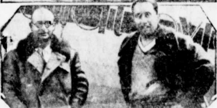
Feu fatigué, le capitaine Mariano BERBERAN (à gauche) et le lieutenant Joaquín COLLAR, membres de la Force Aérienne espagnole, sont ici photographiés à Camaguey, Cuba, à la fin de leur envol record de Séville, Espagne, dans leur avion Cuatro Vientos (en haut). Ils survolèrent 4,960 milles d'océan.