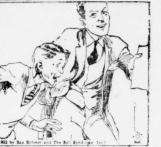
"Eh bien!" dit-il à Dick, "voilà la permission de ton père pour que le voyage aie cours. Maintenant, il s'agit surtout de savoir si tu veux venir!" — "Si je veux aller?" cria-t-il, fou de joie. "Seriez-vous assez mesquin pour m'en empêcher?"