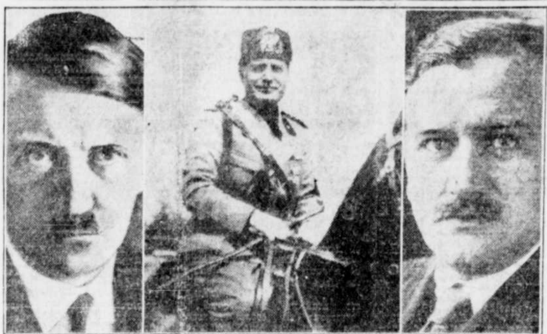
Les dictateurs de l'Allemagne et de l'Italie (on voit de gauche à droite) se rencontreront bientôt avec le premier ministre de France (à droite) pour discuter des problèmes qui intéressent leur pays et faire disparaître les causes de friction entre eux.

DALADIER CONFÉRERA AVEC HITLER ET MUSSOLINI