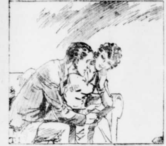
Les jours qui suivent notre terrible aventure aux mains de Fu Manchu, Smith se rétablit lentement de son choc nerveux et de sa blessure au front. Karamanah et moi nous parlions souvent entre nous de nous en aller en Orient. Je me décidai finalement de toujours rester près d'elle, et je me préparai joyeusement à m'exiler de l'Angleterre, tant je l'aimais.