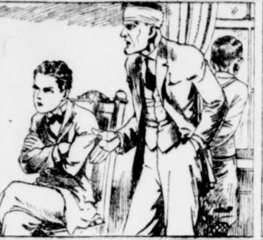
Smith et Aziz accueillirent notre projet avec joie. Maintenant que Fu Manchu était bien mort. C'met, évidemment, s'attendait à reprendre son poste dans l'Orient. Il expliqua que sa tâche serait moins monotone, en étant près de nous. Mais, Dick était triste à la pensée de nous quitter.