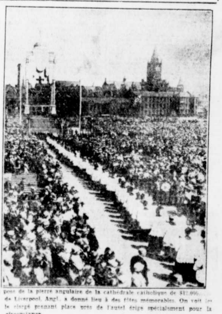
Le pose de la pierre angulaire de la cathédrale catholique de $10,000,000 de Liverpool, Angl., a donné lieu à des fêtes mémorables. On voit ici le clergé prenant place vers de l'autel drapé spécialement pour la circonstance.