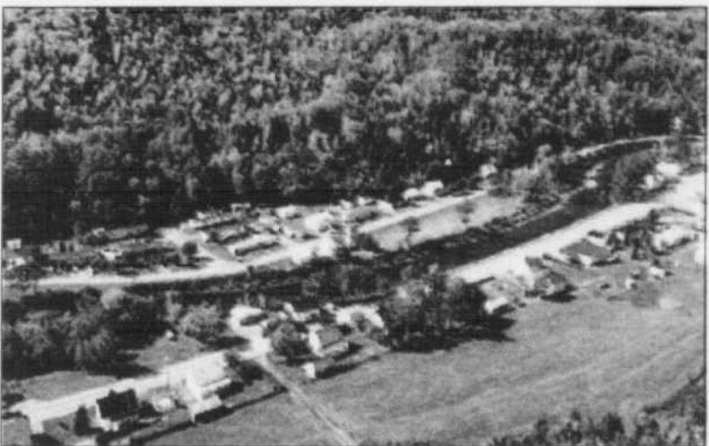
Municipalité de Petit-Saguenay.

Le village, est animé par une rivière enchantée et embellie de jardins fleuris. C'est aussi à partir du quai de Petit-Saguenay que l'on peut contempler les plus beaux couchers de soleil de la province. Passionnés de pêche, de randonnée, amateurs de la nature et artistes, vous trouverez au Bas-Saguenay une foule d'activités passionnantes.