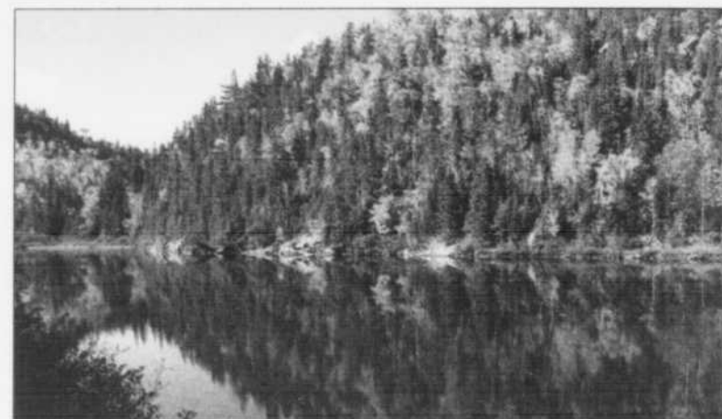
SYMPOSIUM - Du 6 au 10 octobre 2005 aura lieu la 15 e édition du Symposium provincial des Villages en Couleurs de L'Anse-Saint-Jean et Petit-Saguenay. L'événement se déroulera sous le thème «Les Couleurs de nos 15 ans».

Couleurs que ça se passe! Les gens de L'Anse-Saint-Jean et Petit-Saguenay invitent la population à venir s'imprégner des panoramas fabuleux qu'offrent le fjord et les montagnes du Bas-Saguenay à l'occasion de cet événement culturel d'envergure. Cette année, une 15 e édition haute en couleurs attend les visiteurs.