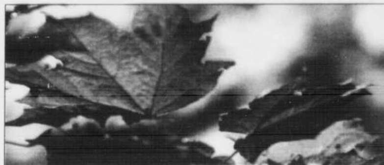
L'automne, un spectacle de couleurs.

AU GÎTE DU BARRAGE 3, rue Côté, L'Anse-Saint-Jean www.augitedubarrage.com