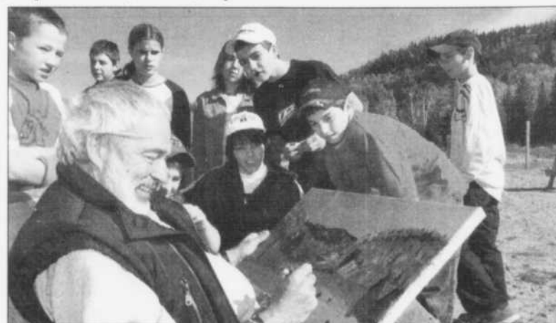
Peinture en plein air.

Vous pouvez également visiter le site Internet du Symposium provincial des Villages en Couleurs, au www.cybernaute.com/symposium .