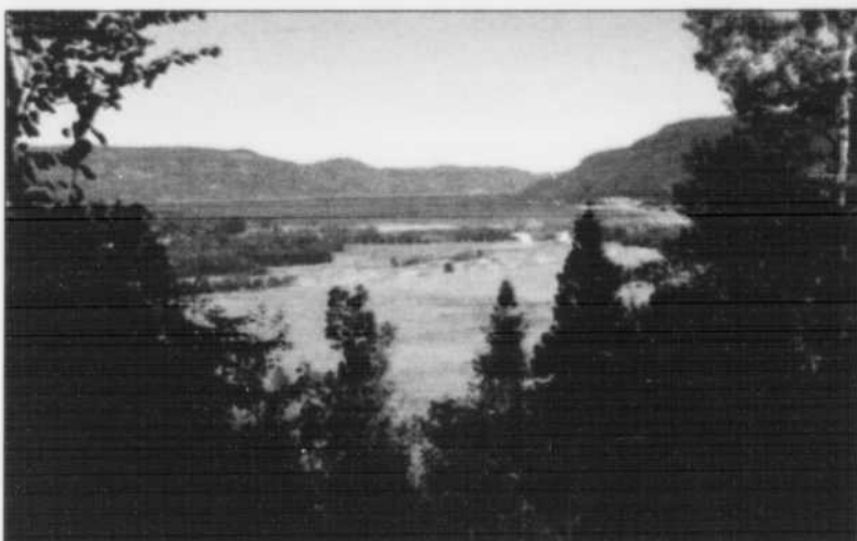
Municipalité de L'Anse-Saint-Jean.

L'Anse-de-Tabatière, le pont couvert de 1929 (emporté deux fois par la rivière, il fut aussi l'illustration du billet de 1000 dollars pendant près de quarante ans), l'église et le presbytère, ainsi que les maisons du faubourg non loin du quai sont autant de sites merveilleux à découvrir.