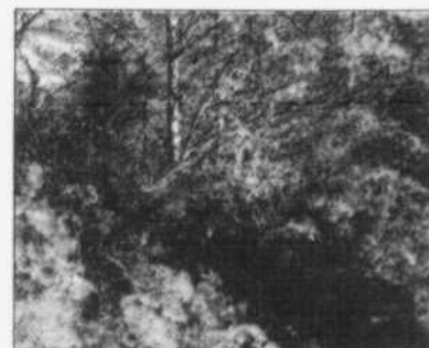
SPECTACLE DE COULEURS - C'est un grand plaisir de revenir chaque année dans votre beau coin de pays. Visite qui, fort heureusement, coïncide avec le Symposium. Culture en randonnées pédestres; nous sommes comblés! (tiré du Livre d'Or 2003, Symposium provincial des Villages en Couleurs de L'Anse-Saint-Jean et Petit-Saguenay).