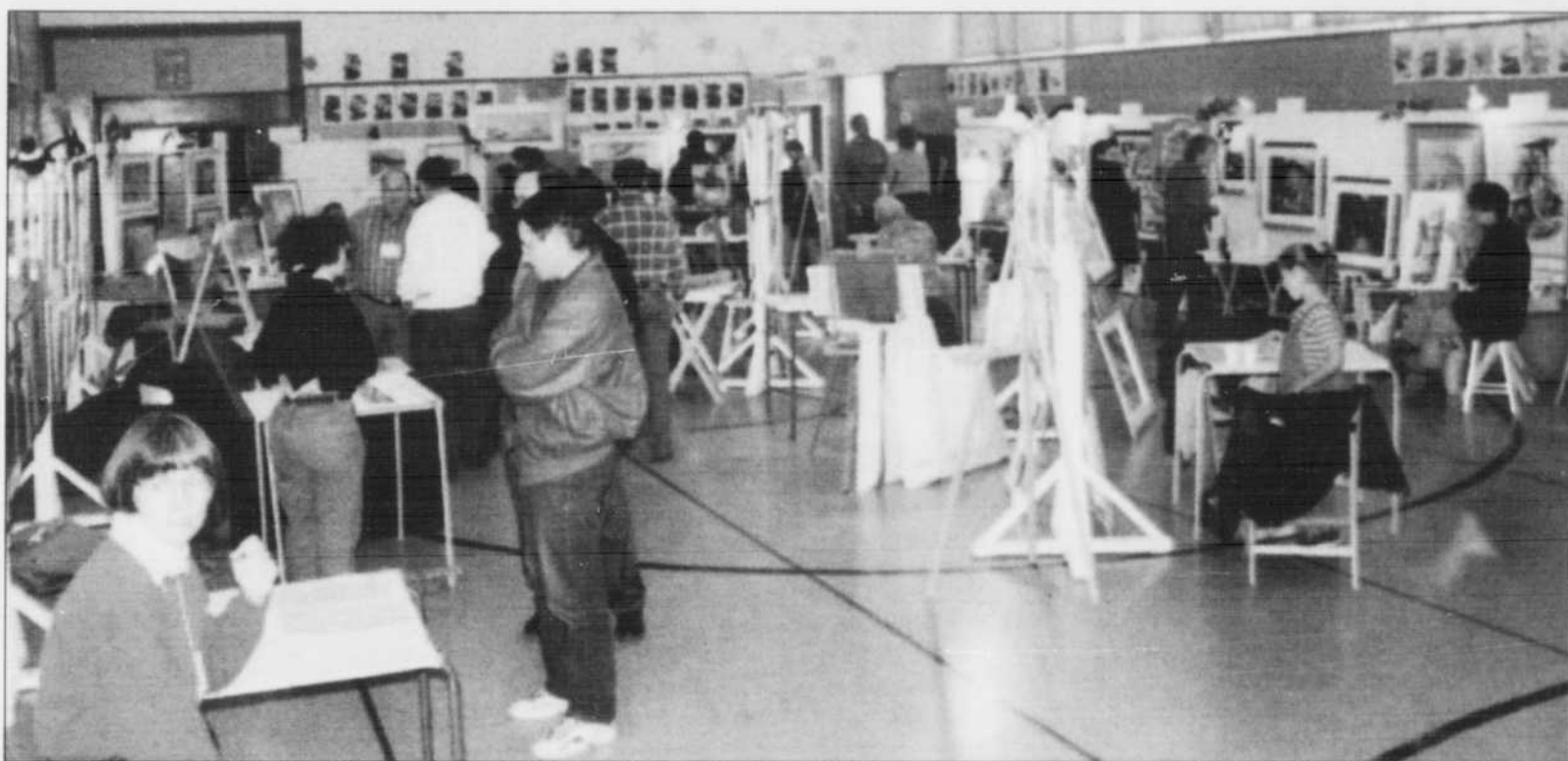
SALLE D'EXPOSITION - Pendant leur passage dans les salles d'exposition de Petit-Saguenay et L'Anse-Saint-Jean, les visiteurs intéressés pourront participer à un rallye de découvertes artistiques. Une occasion de se familiariser avec l'art et de discuter avec les artistes présents.

Les questions et coupons-réponses pour le rallye se trouvent à la page centrale du présent cahier. À noter que seuls les coupons originaux seront acceptés.