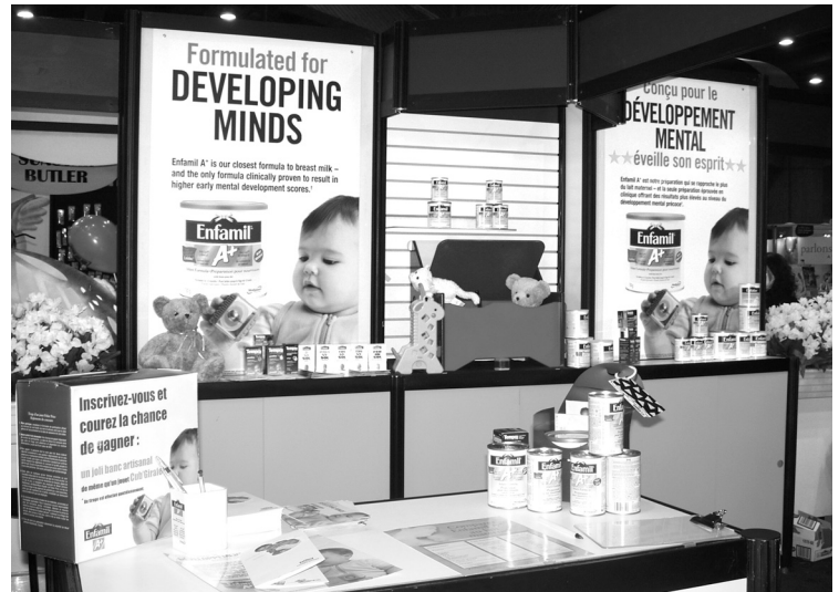
Salon Maternité Paternité Enfants de Montréal, avril 2004

Par ailleurs, les pressions commerciales exercées par l'industrie peuvent avoir des effets négatifs sur le choix du mode