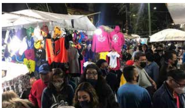
Les tiendas à la sortie de l'arena

Bibliographie : Wikipedia, Le blog d'un linguiste (Lionel Meney), Arena Mexico