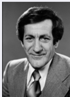
Marc-André Bédard

Par François Legault, premier ministre du Québec