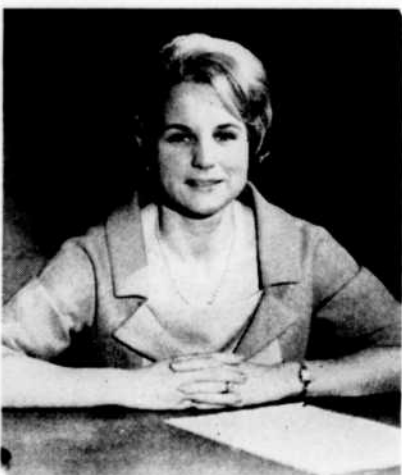
JEANNE SAUVÉ est l'animatrice de l'émission Lettre ouverte au cours de laquelle, tous les dimanches après-midi à 2 h. 30, les jeunes discutent de leurs problèmes.