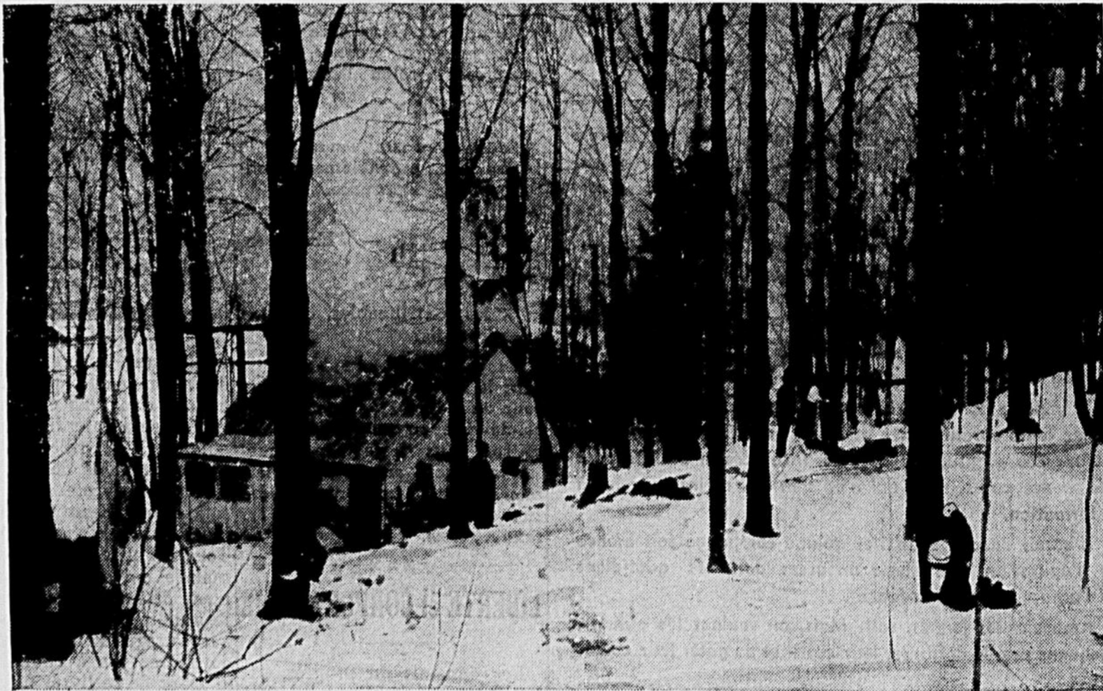
La sève d'érable du Québec est renommée dans le monde entier