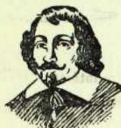
SAMUEL DE CHAMPLAIN