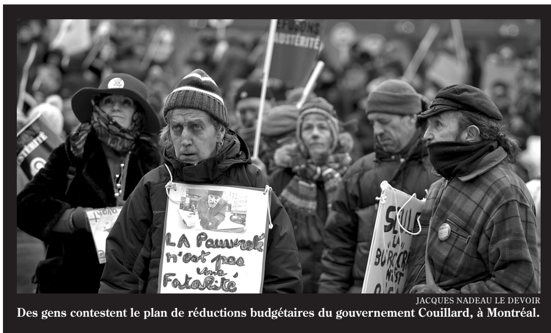
Des gens contestent le plan de réductions budgétaires du gouvernement Couillard, à Montréal.

Les libéraux ont considérablement réduit le programme. La gratuité est limitée aux cas où la fertilité est compromise et pour les ser-