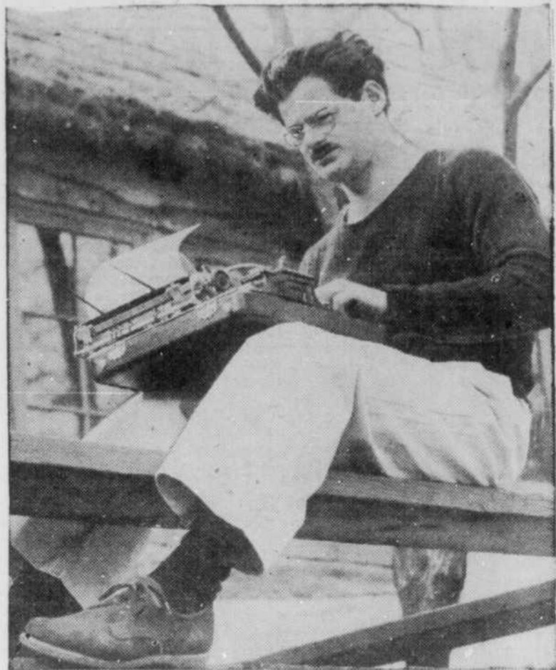
On voit ici à l'oeuvre l'auteur et réalisateur des nouvelles pièces du "Columbia Workshop" diffusé par le poste CKAC tous les dimanches soir de 10 h. 30 à 11 h. C'est en effet NORMAN CORWIN que l'on aperçoit sur cette photo en train de préparer la continuité du programme de dimanche prochain.

Norman Corwin prépare son programme du dimanche à CKAC