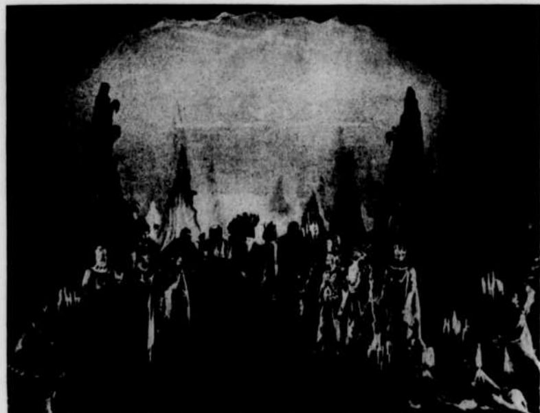
LA TEMPÊTE , pièce de William Shakespeare, dont nous reproduisons une scène ci-haut, sera entendue au réseau Français le 22 septembre, de 8 h. 30 à 10 heures du soir.

L'orchestre jouera The Night is Young and You're so Beautiful , de Suesse; Carioca , de Vincent Youmans; et enfin Stardust , de Hoagy Carmichael.