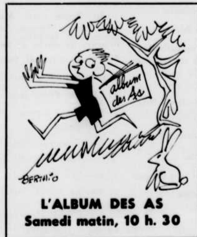
L'ALBUM DES AS Samedi matin, 10 h. 30