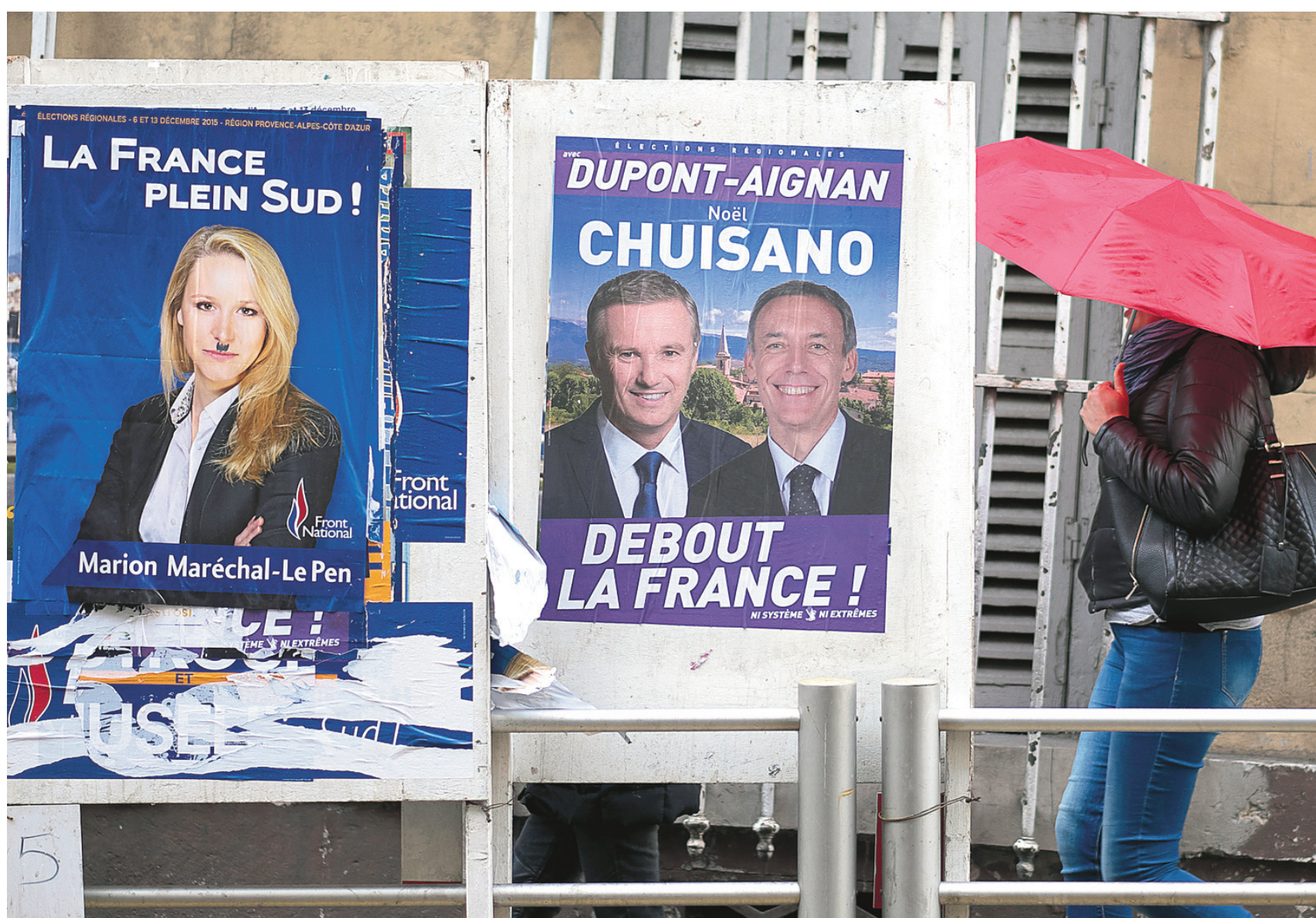
En poussant jusqu'au bout l'affrontement avec le FN, quitte à peindre celui-ci en parti fasciste, le président François Hollande érige celui-ci en adversaire principal.