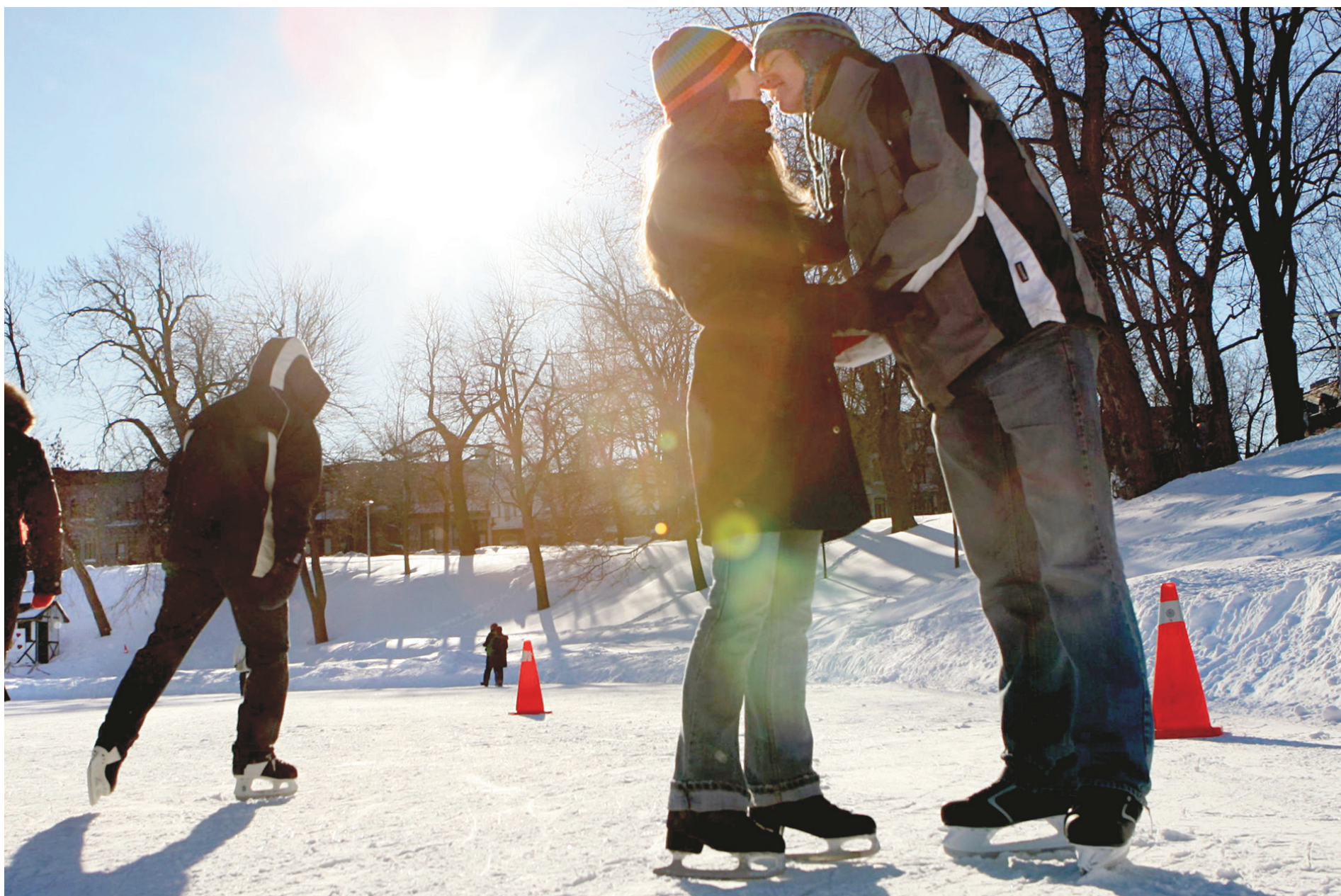
Le combat entre le désir pulsionnel et la volonté rationnelle est parmi les plus déchirants que l'être aura à affronter au cours de son existence.

Cette analogie entre la relation de l'homme et de sa passion et celle d'un esclave et de son maître est également présente chez Emmanuel Kant (1724-1804); à ses yeux, nous sommes de vulgaires marionnettes de nos sentiments. En effet, même avec de la volonté, nous ne pouvons choisir rationnellement les objets sur lesquels notre désir se projette, car, comme l'indique Kant dans les Fondements de la métaphysique des mœurs , « le concept du bonheur est un concept si indéterminé que [...] personne ne peut jamais dire en termes précis et cohérents ce que véritablement il désire ». En d'autres termes, nul ne possède le savoir nécessaire pour choisir ce qui est réellement bon pour lui, car il faudrait pour cela connaître tous les facteurs qui influenceront notre avenir.