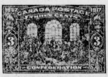
Le timbre-poste de trois sous émis par le gouvernement canadien, à l'occasion du cinquantenaire de la Confédération.