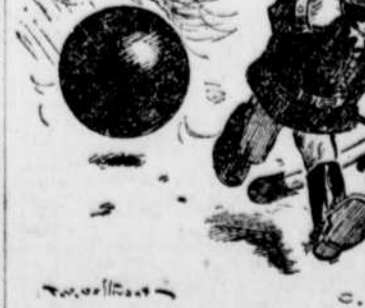
Guillaume. — Croyez-vous pas, Hindenburg, que nous avons attiré l'ennemi assez loin ? Le Maréchal. — Oui, mais il ne veut plus s'arrêter. (Life).