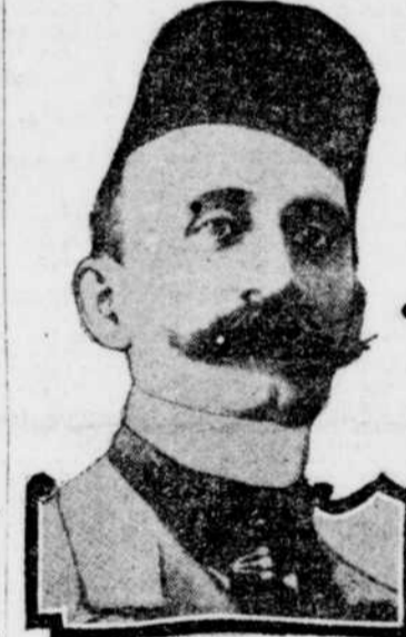
LE PRINCE HUSSEIN KAMEL PACHA, Khédive d'Egypte depuis 1914, qui vient de mourir.