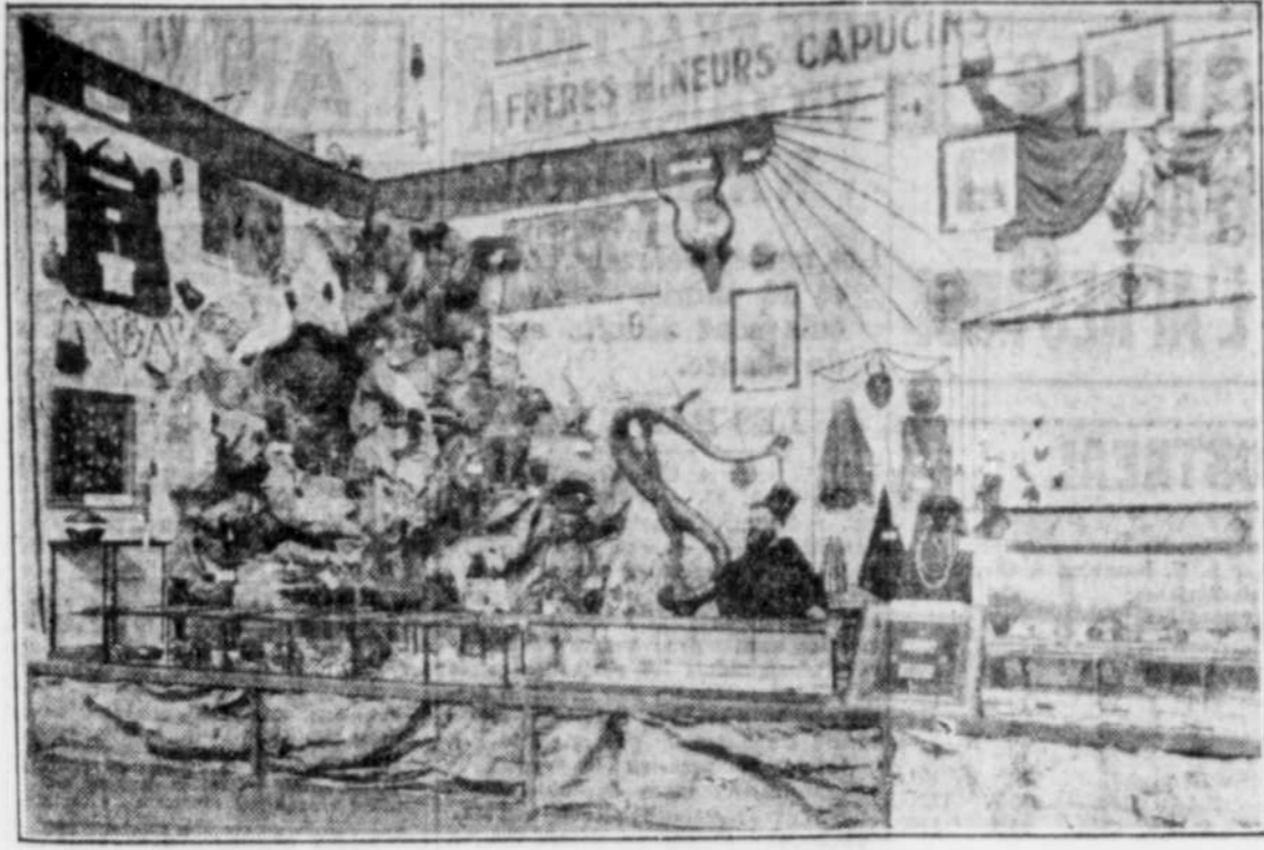
Un coin du kiosque des Frères Mineurs Capucins à l'Exposition Missionnaire qui se tient au Manège Militaire, de la rue Craig, Montréal, du 21 au 28 septembre. On peut y voir toutes sortes d'objets, fabriqués par les peuples d'Abyssinie, d'Éthiopie, où ces frères poursuivent leur œuvre évangélique. On y aperçoit aussi des animaux empaillés de ces pays. Cette exposition a pour but de faire mieux connaître l'œuvre accomplie dans les missions par les quelque 1,500 Canadiens qui se sont consacrés à l'évangélisation des païens dans le monde entier.

(De notre correspondant) Princesville, 25.— Le train de démonstration organisé par le Ministère de l'Agriculture en coopération avec le chemin de fer Canadien National est passé ici. Une grande foule de cultivateurs en ont fait la visite et plusieurs ont apporté des échantillons de leur terre pour les faire analyser par les experts chimistes qu'il y a à son bord. Le train est arrêté à 12 endroits la semaine dernière l'assistance totale se chiffre à 3,700 visiteurs et 2,400 cultivateurs ont fait analyser des échantillons de leur terre afin de connaître quelles sont les applications de chaux ou d'engrais chimiques ils doivent faire pour augmenter les rendements des récoltes. Les organisateurs sont satisfaits au-delà de leurs espérances du succès de l'initiative. Partout les cultivateurs montrent beaucoup d'intérêt et demandent plusieurs renseignements aux conférenciers qui sont des mieux disposés à leur répondre. Le clergé et les hommes d'affaires contribuent partout leur large part au succès de l'entreprise en organisant des excursions. Les cultivateurs viennent même des paroisses éloignées de quinze et vingt milles des stations où le train arrête. Plusieurs