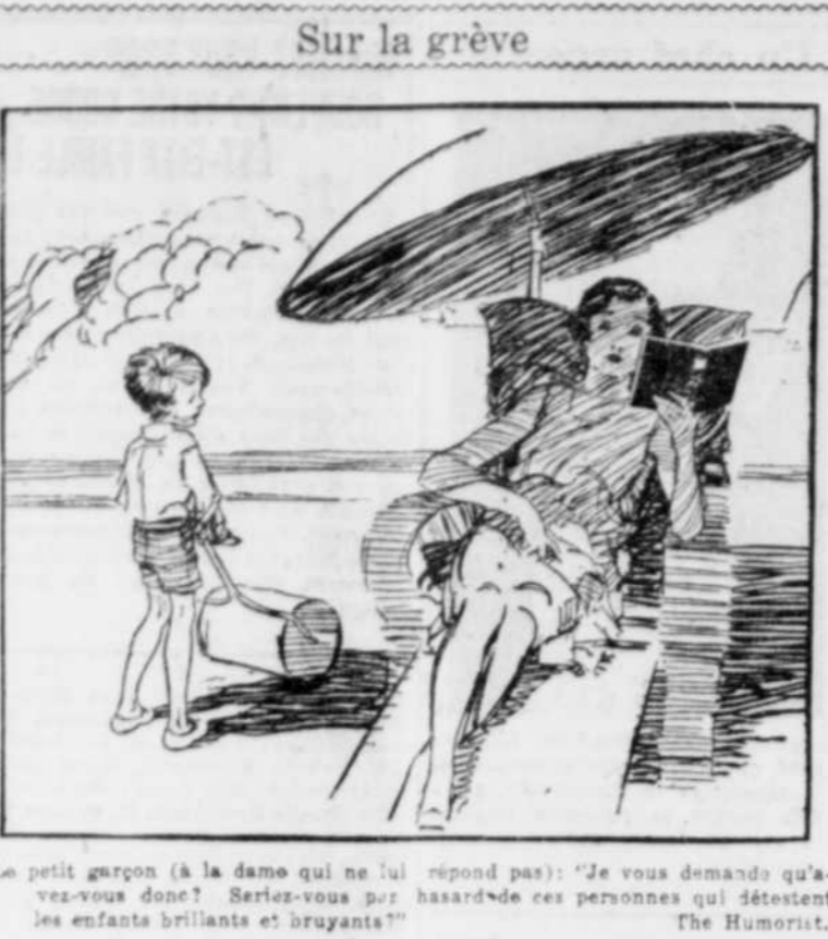
Le petit garçon (à la dame qui ne lui répond pas): "Je vous demande où est-ce que vous allez? Seriez-vous par les enfants brillants et bryantins"

Sur la grève Le petit garçon (à la dame qui ne lui répond pas): "Je vous demande où est-ce que vous allez? Seriez-vous par les enfants brillants et bryantins" The Humorist.